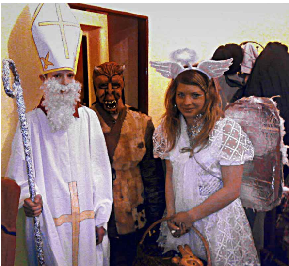
Na výroční schůzi Svazu tělesně postižených přišli školáci převlečení za Mikoláše, čerta a anděla.