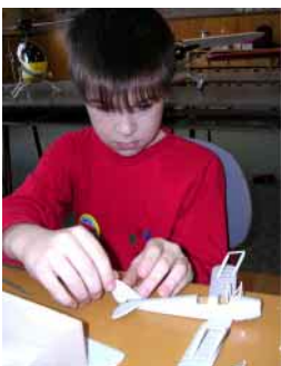
Vítání občánků, příprava fotbalistů, mladý modelář a zápis prvňáčků. (Fotografie k článkům uvnitř.)