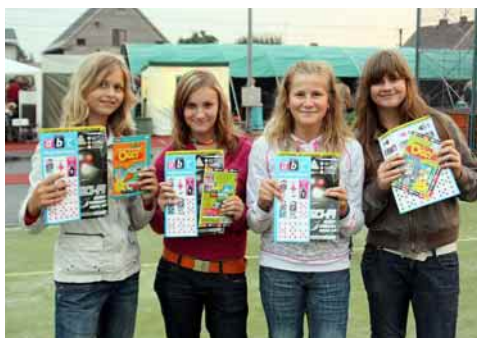
Fotbalistky z Dobré při akci ABC

Další informace o fotbalové přípravce najdete na www.fotbaldob-rauf-m.blog.cz