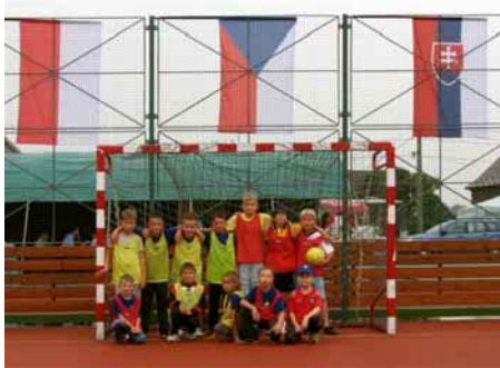
Zahájení tréninků přípravy na Velké dober- ské.