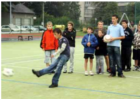
Mnoha fotbalových soutěží se zúčastnili i žáci ze Slovenska.