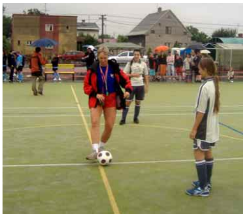
Zahajovací výkop paní starostky odstartoval turnaj