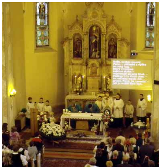
Folklorní slavnosti v Ochodnici: Tradiční průvod Folkloru. Ihned po příjezdu se začala navazovat družba. Snímek ze společné mše. Vystoupení Ostravičky.