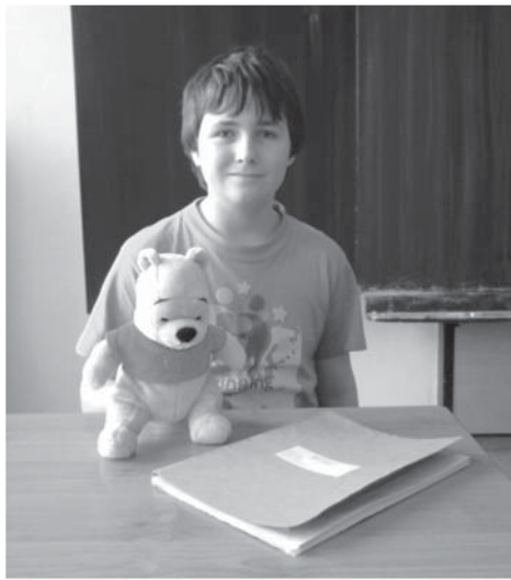
„Je nejvyšší čas dát si něco malého,“ řekl Pú.

Medvídek Pú může být medvěd s „malým rozumkem“, avšak má dost rozumu k tomu, aby konal moudře. Pú rozhodně není takovým medvědem, který by se snažil za každou cenu věci uspěchat (i ty dobré), nebo se mrzel, že se mu všechna přání nesplní hned, teď a tady. Kdybyste ho však