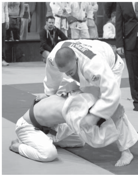
Jerglík vítězně v souboji o bronz.