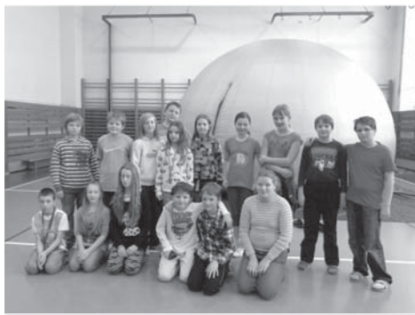
Žáci 5. B připraveni na cestu za poznáním vesmíru.