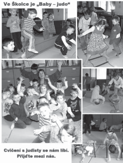
Cvičení s judisty se nám líbí. Přijďte mezi nás.