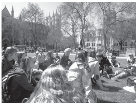
Odpočíváme na trávniku při výkladu slečny průvodkyně mezi Parlamentem a Westminster Abbey.

takový stupeň kyselosti jako u nás běžný jablečný ocet a společně s křupavými hranolky vytváří neopakovatelnou chuť, zvláště pak v kombinaci s rybou, jmenovitě treskou, smaženou v pivním těstíčku a podávanou s různými přílohami, z nichž k nejtradičtějším patří rozmačkaný hrášek a tatarská omáčka. Laskavý čtenář si tuto pochoutku může v Anglii objednat na každém rohu pod názvem Fish and Chips.