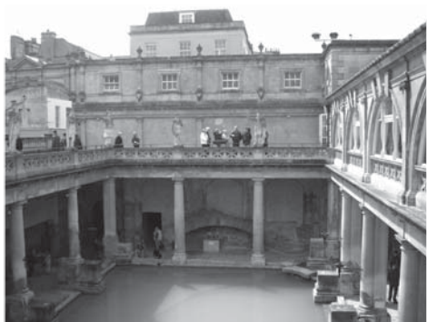
Římské lázně v Bathu. Nedivme se prázdnému bazénu, koupat se mohou jen římsští občané.

mohly obdivovat archeologické nálezy a stále fungující bazény, seznámit se s technologií výroby olověných trubek na vodu nebo dutých odlehčených střešních tašek, proniknout do stavitelského a inženýrského mistrovství starých Římanů, nahlédnout do nitra původního chrámu a požádat bohyni Sulis Minervu o požehnání či v jejím jménu vrhnout nejstrašnější starověkou kletbu na své nepřátele. To poslední, zdá se, příliš nefungovalo, zřejmě nedostatečná znalost starověké latiny způsobila u bohyně nepochopení a místo prokletí nám raději popřála příjemný pobyt.