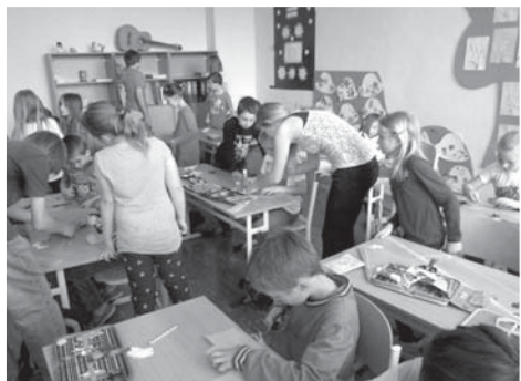
Žáci osmých ročníků vedou své mladší spolužáky během Dne Země. Mladší žáci byli svými staršími vzory nadšeni.

Stává se již tradicí, že oslavu svátku naší planety Země připravují starší spolužáci svým mladším kamarádům. Žáci osmých ročníků, kteří docházejí do volitelného předmětu Ekologická výchova, zaměřili svůj letošní program na praktické dovednosti.