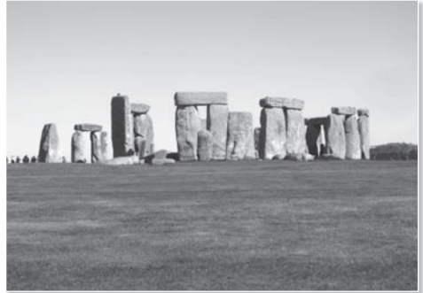
Obdivujeme monumentální vznešenost Stonehenge.

sjíždějí všichni podivíni, věční poutníci, mystikové a stárnoucí hippies z celé Británie. Podle zcela ověřených zpráv zde má stálou adresu i několik zbývajících skřítků.