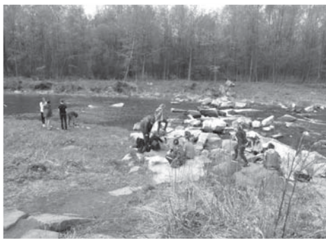
Projektu Voda počasí poměrně přálo a děti si odnesly řadu terénních zkušeností.