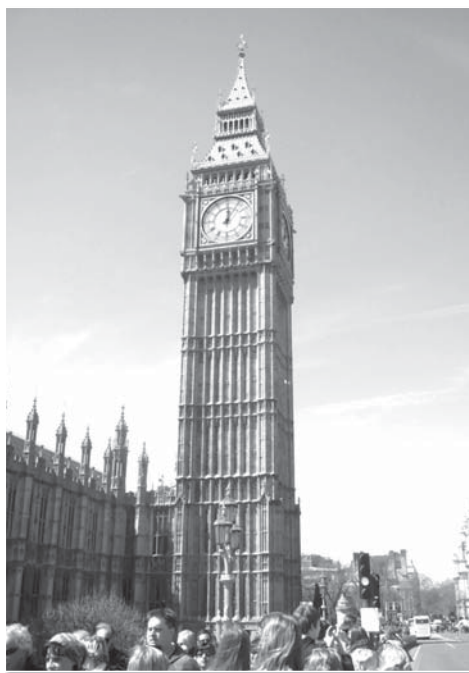
Hlavní symbol Londýna a celého Spojeného království se tyčí přímo před našimi udivenými zraky.