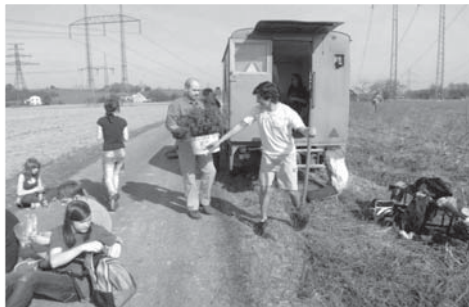
Žáci devátých ročníků sázejí stromky v rámci projektu Člověk a jeho vztah k životnímu prostředí v obci.

prostředí vzniká právě ve vnímání estetické upravenosti vlastního okolí.