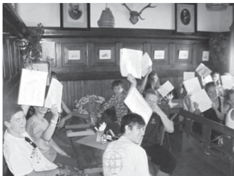
Žáci 8. C letos dostali svá vysvědčení v chatě na Prašivé.