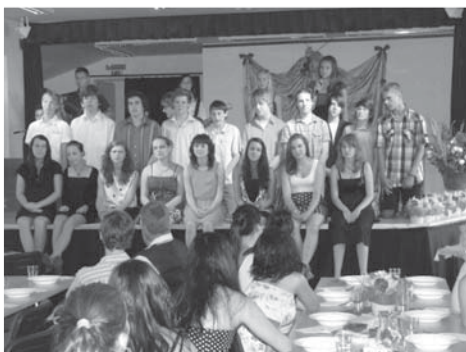
Žáci 9. B představili vlastní pěvecký sbor i s živým hudebním doprovodem.