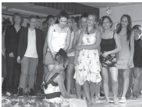
Pěvecká čísla žáků 9. C udivovala propracovanou choreografií.