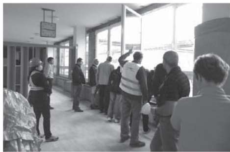
Zástupci obce společně s vedením školy kontrolují postup revitalizačních prací.

Vzhledem k probíhající revitalizaci je náš nejbližší cíl vše zvládnout i za plného provozu školy, protože revitalizace by měla probíhat do listopadu. A když už škola nebude obehnána červenou páskou, můžeme se soustře-