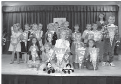
Třída 1. A je připravena k zahájení školního roku.