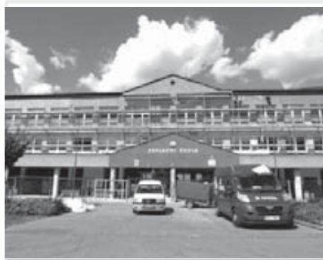
Venkovní práce na novém kabátu školy jsou stále v plném proudu ...

ním kuchařkám. Ti všichni trávili poslední dny úklidem a opravami. Aby se děti vrátily nejen do čistého, ale i do příjemně útulné-