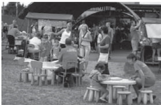
Děti se dobře bavily a s velkým nasazením plnily disciplíny, foto archiv Charity FM.

Naše stánky a stanoviště byly po celé odpoledne doslova v obležení. Velký zájem dětí i dospělých nás opravdu překvapil a potěšil.