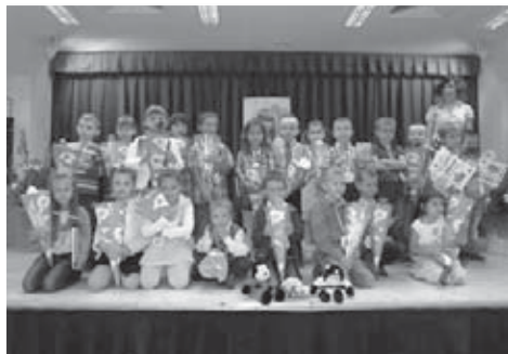
A 1. B rozhodně nezůstává pozadu.