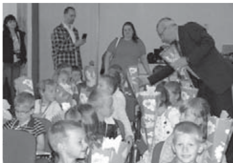
Pan starosta rozdával prvňáčkům kornouty plné laskomin.

43 malých prvňáčků tak společně s jejich rodiči a prarodiči uvítalo vedení školy i obce a jejich nové třídní učitelky. Děti obdržely kornouty naplněné dobrotami a pohádkovou knížku, kterou si určitě již brzy