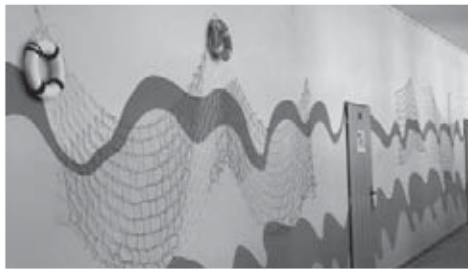
... uvnitř však již žáky vítají nově vyzdobené chodby a třídy.