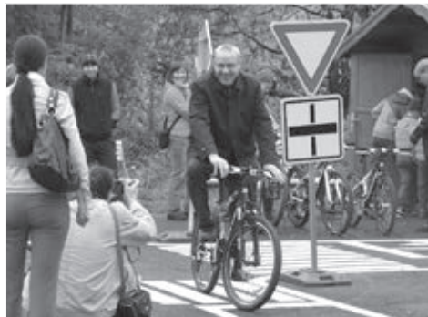
Horský bicykl si vyzkoušel i pan starosta.

slavnostního otevření nového dopravního hřiště za účasti zástupců Plzeňského Prazdroje a vedení obce Dobrá. Pozvání