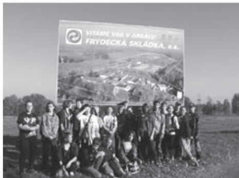
Ekologická exkurze se všem účastníkům velmi líbila.