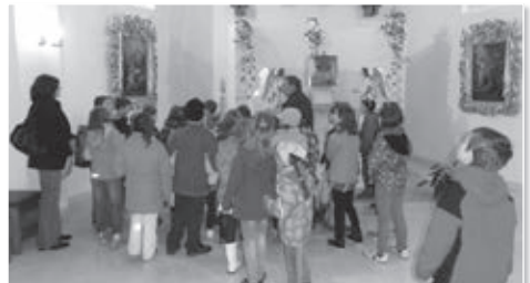
Pan farář se ukázal být tím nejlepším průvodcem na půdě kostela.