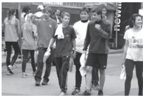
Radost po závodě.

roce bude počet žáků na startu Hornické desítky 2014 ještě větší, než letos.