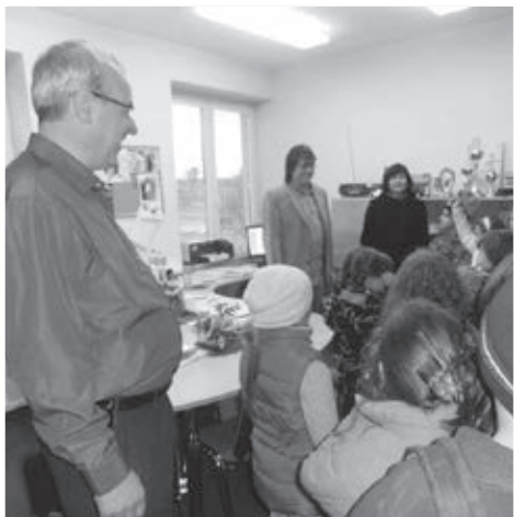
Setkání s vedením obce bylo oboustranně příjemné.