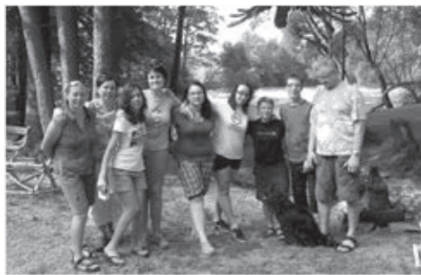
Krkavec 2013 – vodácký výlet

Těsně před letošními letními prázdninami odjela na několik dní do malebné přírody Jižních Čech, kde si kromě spousty jiných aktivit také sjela vodu na raftech. Aktivit tohoto sdružení je opravdu mnoho a vypsat všechny by vydalo na samostatný článek. Všichni, kdo se podílejí na jejich organizaci a samotné realizaci, patří k našim dalším andělům.