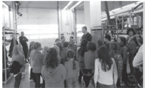
Děti byly uneseny z vyprávnění hasičů a ukázek hasičské techniky.

Děti navštívily Integrované výjezdové centrum v Nošovicích, jehož stanice slouží všem základním složkám Integrovaného záchranného systému. Děti se tak mohly seznámit s hasičskou technikou, dozvědět se nové informace o práci policistů a zdravotních záchranářů, ale také si mohly uvědomit, jak všechny tři složky záchranného systému spolupracují a fungují jako jeden velký tým.