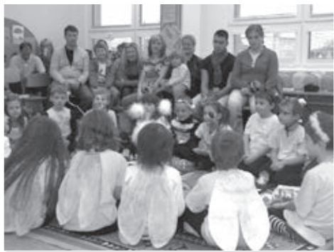
Prvňáčci se na svůj slavný den převlékli do kostýmů pilných včelíček.