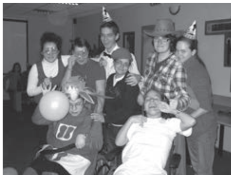
Karneval v Bráně