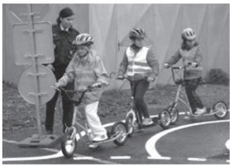
Na dodržování pravidel silničního provozu dohlížely během slavnostního dopoledne strážnice Městské policie.

V rámci realizace projektu „Jeď a mysl!“ bylo zařízeno nové dopravní hřiště o rozloze 330 m 2 , které je vybaveno dopravním značením, deseti horskými koly a deseti koloběžkami, bezpečnostními přilbami a dětskými bezpečnostními prvky. Součástí