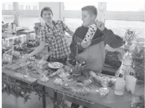
„A zde máme naše fenomenální svíce vyrobené z vosku supervčel.“

citu, který v nich vzbuzuje jisté děvče z 8. C. Se svými krásně melancholickými vzpomínkami pak mohli usednout v žákovské kuchyňce, která se pro tento den změnila ve vánoční kavárnu, a potěšit vyprahlé hrdlo punčem či kávou, k níž se znamenitě hodily roztodivné vánoční pamlsky podávané za nepatrný peníz příjemnou obsluhou.