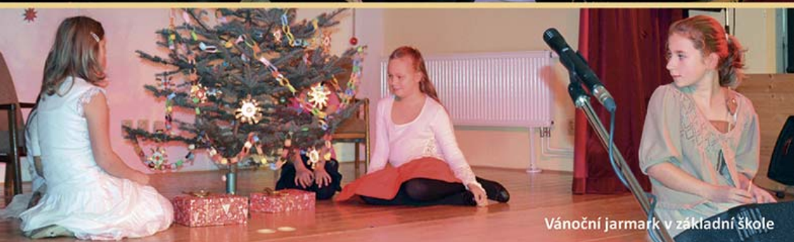
Vánoční jarmark v základní škole