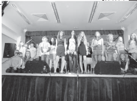
Sborový zpěv vánočních písní potěšil návštěvníky vánočního koncertu.

chaly v sále vánoční vystoupení, jinak bych se obával nejhoršího.