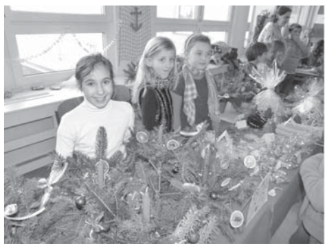
„Kupte si, paní, druhý takový svícen neseženete.“

V sobotu 14. prosince děly se ve škole věci nevídané. Hned tři veliké a divuplné události přilákaly zástupy vánočních poutníků všech generací zblízka i zdáli – Den otevřených dveří, Vánoční jarmark a Vánoční koncert změnilo na jedno dopoledne Základní školu v Dobré na kulturní centrum srovnatelné v myslích lidí dobré vůle s Goethovým Výmarem.