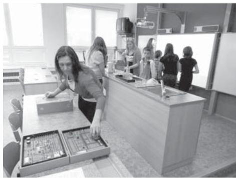
Učebna fyziky lákala na zajímavé hokuspokusy.

Vrcholem celého dne bylo samozřejmě vánoční představení, které si s našimi žáky