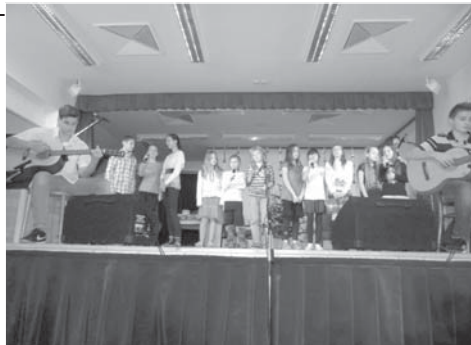
Kromě nadaných pěvců máme i vlastní kytaristy.