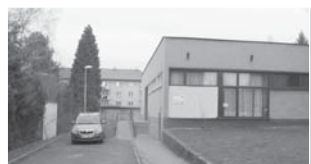
Budova Centra ve Frýdku-Místku