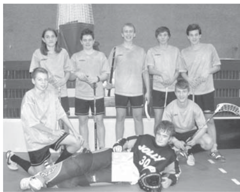
Vítězný tým žáků 8. a 9. tříd.