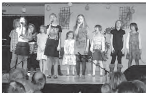
Děti svým maminkám, babičkám a tetám zpívaly s velkou chutí.

Bohatý program se skládal zejména z populárních písní, objevila se ale i scénka O smutném obrovi. Je zajímavé, že velké množství písní bylo slovenské proveniencí, zdá se, že ani po rozdělení Československa děti slovenštinu tolik nezapomínají a záměrně si vybírají slovenské písničky. Vystoupení