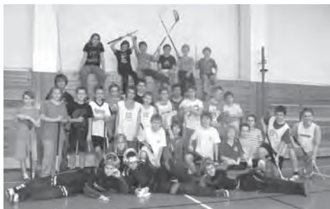
Doberskému florbalu vyrůstají nové naděje.

Ve středu 12. února 2014 se pak konala na naší škole kvalifikace na největší florbalový turnaj v České republice pod názvem ČEZ STREET HOCKEY CUP 2014. Turnaje se zúčastnilo celkem 30 hráčů, kteří byli rozděleni do 5 týmů. Vítězem turnaje, jehož