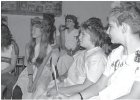
Aténská obec řeší závažné společné otázky.