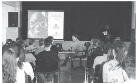
Děti napjatě poslouchaly o každodenním životě svých afrických vrstevníků.

zuální ukázky života v Tanzánii. Věříme, že svým nadšeným přístupem zaseli v dětech semínko filantropie a že jejich slova a osobní příklad nepřijdou nazmar. Laskavý čtenář si může další informace o bohubilé práci, kterou v Africe vykonává občanské sdružení Bez mámy, vyhledat na internetových stránkách www.bezmamy.cz . Najde zde i způsoby, jak je možno přispět na charitativní činnost nošovického sdružení.