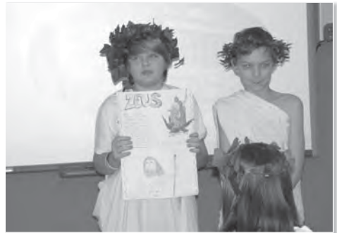
Velký šéf Zeus má v druhém pádě tvar „Dia“.