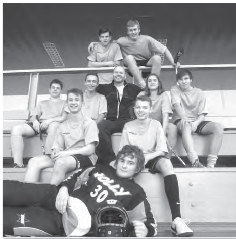
Největší devízou našeho florbalového týmu je skvělý týmový duch.

Chci poděkovat celému týmu, se kterým už spolupracuji od 5. třídy. Během bezmála 5 let se nám podařilo 2x postoupit do celostátního finále ČEZ Street Hockey Cup