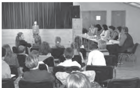
Záběr z obvodního kola recitační přehlídky, které proběhlo v sále naší školy.

Ačkoliv uspěchaná doba nepřeje rozjímavému kouzlu umělecké recitace a – řečeno s básníkem Macharem – „lidstva milióny