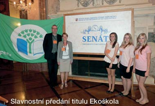
Slavnostní předání titulu Ekoškola