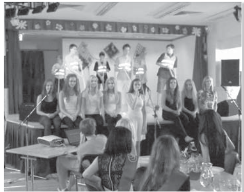
9. B překvapila vtipně nastudovaným videoklipem ve vlastní choreografii.

Každý absolvent byl ceremoniálně ozdoben šerpou a poté proběhl slavnostní oběd s nealkoholickým přípitkem. Loučení s devátáky je pro všechny zúčastněné vždy silný emotivní zážitek. Rodiče i žáci si uvědomují, že děti přecházejí do další důležité životní etapy, pro vyučující je to okamžik hrdosti, ale také smutku, že se s nimi loučí další