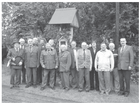
S přáteli myslivci při posvěcení dřevěné plastiky sv. Huberta u myslivecké chaty 28. května 2011.

roku 1991 zůstalo pouze 6. Obec se musela starat o základní a mateřskou školu, později přibyla starost o místní knihovnu a pečovatelskou službu, které okresní úřad předal obci do správy. Bylo třeba řešit každodenní požadavky občanů, udržovat cesty v dobrém stavu, odklízet sníh, což nejednou sám dělal, stejně jako rozvážel obědy, když nebyl nikdo jiný. Vše to dělal rád. Pro každého starostu je nejméně příjemné, když se lidé nedokáží domluvit a se svými stížnostmi a spory se obracejí na „obec“, aby udělala pořádek. To, myslím, bylo pro něj velmi těžké, neboť nikdy nelze vyhovět všem.