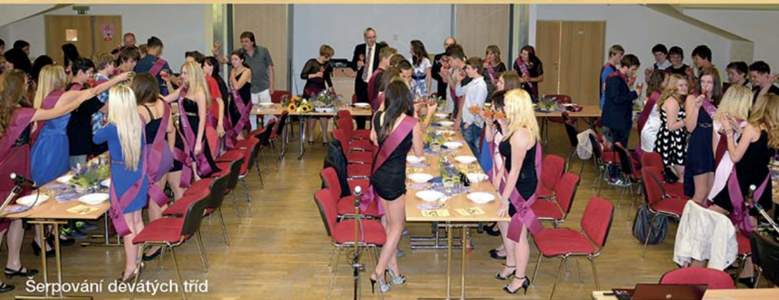
Šerповání devátých tříd