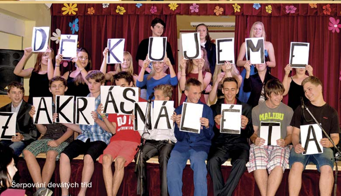
Šerpování devátých tříd