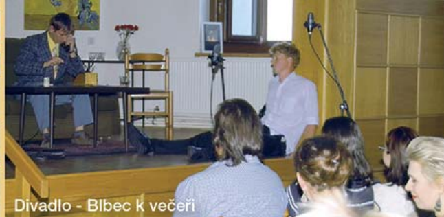
Divadlo - Blbec k večeri