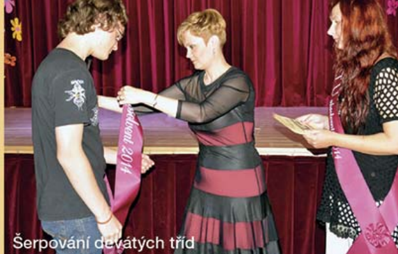
Šerповání devátých tříd