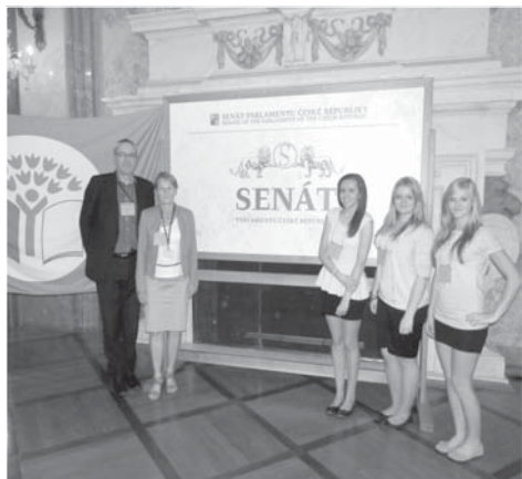
Snímek ze slavnostního předávání mezinárodního titulu Ekoškola ve Valdštejském paláci.