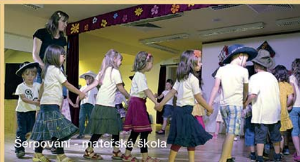
Šerповání - mateřská škola