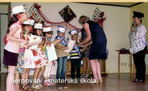
Šerповání - mateřská škola