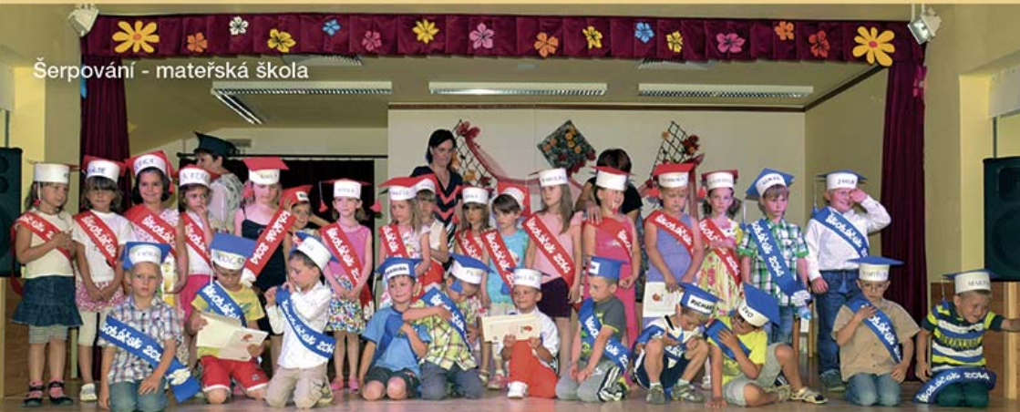
Šerповání - mateřská škola