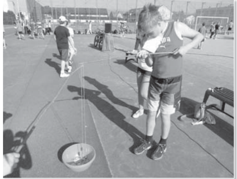
Některé disciplíny byly vsutku netradiční. Zde si například děti zahrály na rybáře.