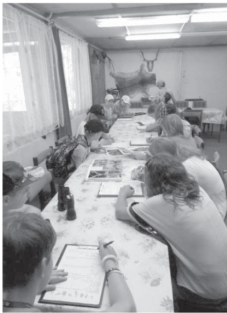
V myslivecké chatě děti řešily řadu zábavných úkolů s lesní tematikou.