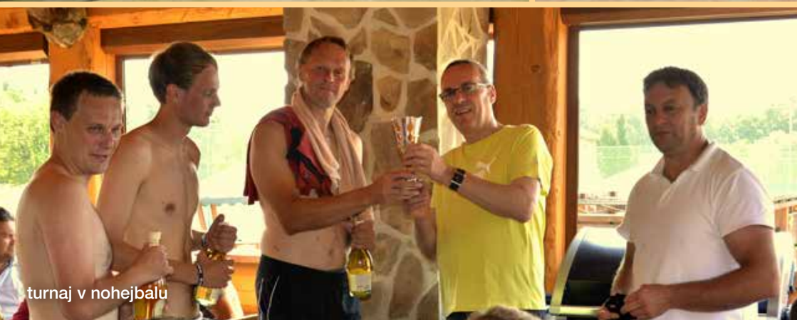
turnaj v nohejbálu