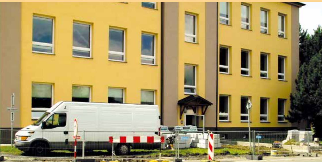
oprava chodníků v obci