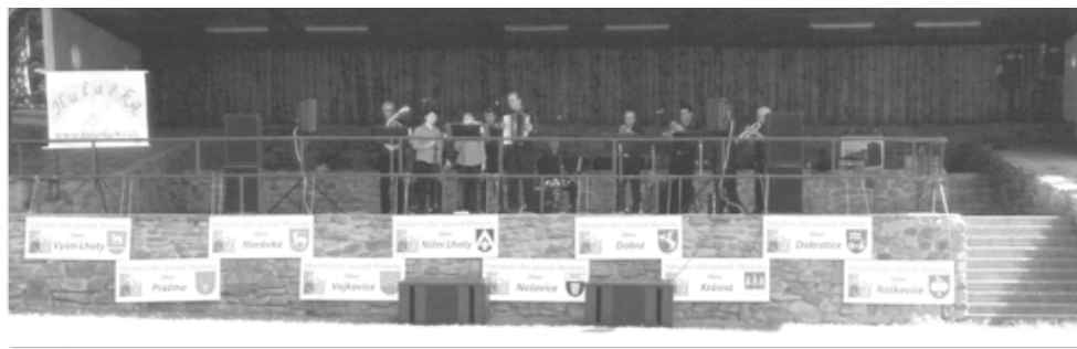
Použité fotografie jsou z roku 2013