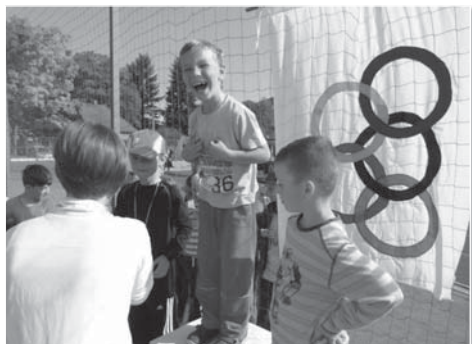
Nelíčená radost ze zisku olympijské medaile.