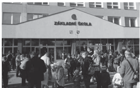
Zní to neuvěřitelně, ale i takto může vypadat sobotní ráno před naší školou.

V sobotu 1. listopadu 2014 se konal největší běžecký závod v regionu Hornické desítky. Potřetí ve své historii se do tohoto závodu zapojila i naše škola. V soutěži škol, kde se soupeřilo o nejpočetnější výpravu, ZŠ Dobrá po třetí za sebou obsadila 1. místo s celkovým počtem 183 startujících žáků. Druhé místo připadlo 1. ZŠ se 141 závodníky a na třetím místě skončila 6. ZŠ. Naše škola byla za vítězství oceněna sportovním vybavením v hodnotě Kč 12 000,- a 5 kg bonbónů. V soutěži tříd na 1. stupni vyhrála třída 5. A a na 2. stupni zvítězila třída 6. C.