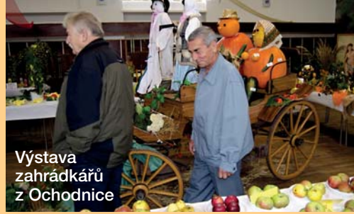
Výstava zahrádkářů z Ochodnice