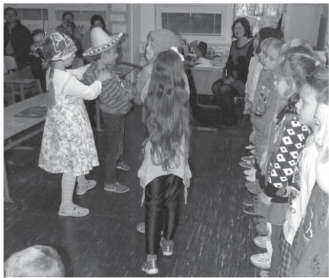
Pohádka O veliké řepě se malým hercům velice povedla.