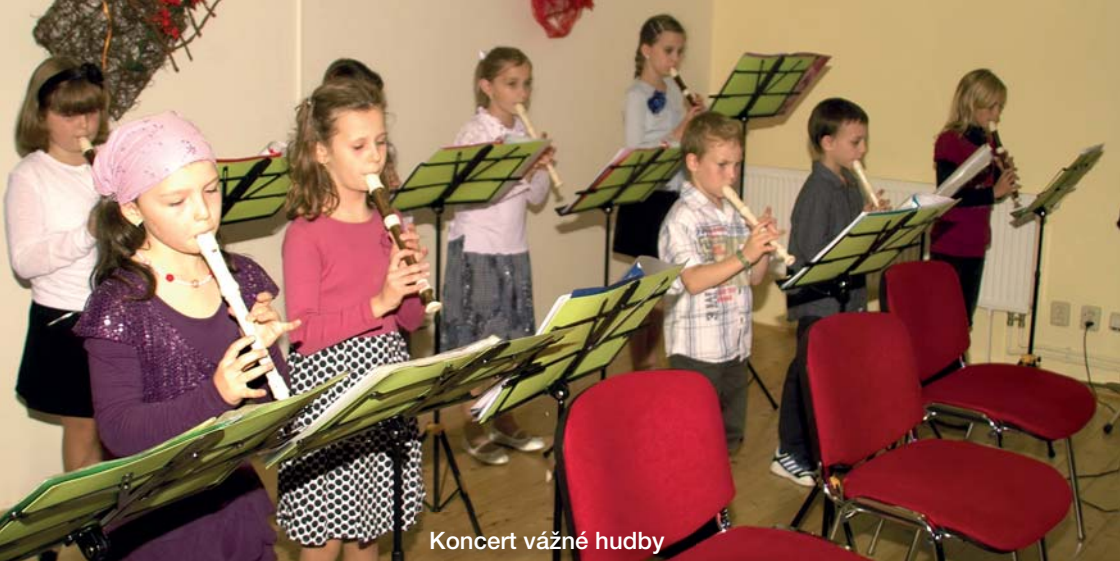
Koncert vážné hudby