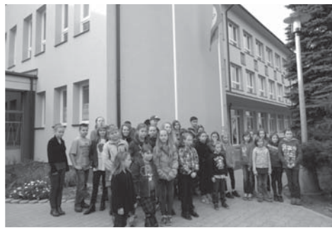
Setkání dvou ekotýmů na Základní škole v Raškovících.