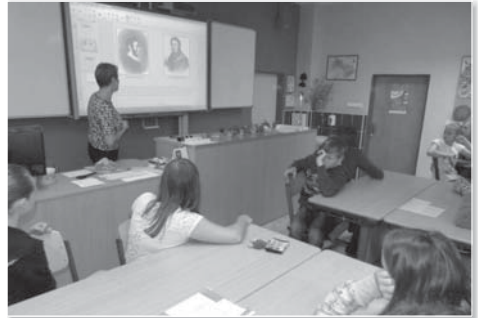
V učebně přírodopisu se děti seznamovaly s názvy léčivých bylin ve slovanských jazycích.