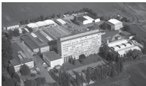
Budova VÚHŽ a.s.

Krátce po sametové revoluci vznikla celorepubliková potřeba restrukturalizace a privatizace hutnictví. Tím se značně snížila poptávka po „čisté“ výzkumné činnosti.