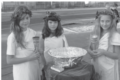
Řecké bohyně se chystají zapálit olympijský oheň.

Vyvrcholením zahajovacího ceremoniálu byla olympijská štafeta nejlepších sportovců 1. – 5. ročníku, kteří předali hořící pochodeň řeckým bohyním, představovaným žačkami 5. ročníku k zapálení olympijského