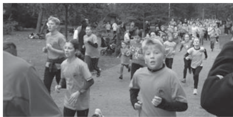
Naše děti běžely nejen pro zdraví, ale také pro hodnotné ceny pro naši školu.

Chci poděkovat všem svým kolegům, kteří si v sobotu udělali čas a pomohli se zajištěním akce, dále pak všem žákům, kteří se závodu zúčastnili a podpořili tak svoji školu v boji o hodnotné ceny. Pevně věřím, že se všem účastníkům závod líbil a že v příštím roce bude počet žáků na startu Hornické desítky 2015 ještě větší než letos. Není důležité zúčastnit se, ale zvítězit ☺. Záznam z letošního závodu si můžete prohlédnout na stránkách TV Polar na linku http://polar.cz/archiv/video/sportovni-studio-03-11-2014-17-14 , reportáž o závodu začíná na čase 10:20.