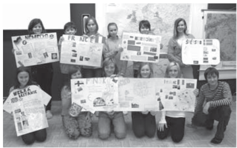
Informační plakáty o jednotlivých evropských státech vykazovaly vysokou estetickou úroveň.

Následujícího dne se žáci rozdělili na přič třídami podle jednotlivých států, vzniklo tedy 9 „národních“ skupin o šesti až sedmi členech. Za svůj stát pak žáci soutěžili ve vědomostních kvízech a dovednostních disciplínách v učebnách zeměpisu a dějepisu, v učebně výtvarné výchovy si vyrobili sportovní dresy svého státu.