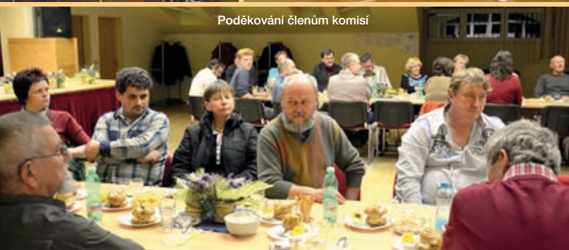
Poděkování členům komisí