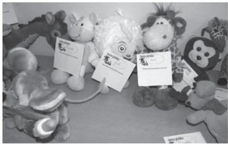
Plyšáci nyní čekají, až se jejich budoucí majitelé chopí iniciativy.