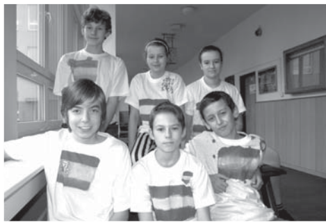
Vítězné družstvo Španělska. Arriba España!

Výsledky zápolení z druhého a třetího dne projektu se sečetly a byly vyhlášeny tři nejlepší týmy. Na stupni nejvyšším stanula reprezentace Španělska, o pořadí na druhém a třetím místě musela díky rovnosti bodů rozhodnout až dodatečná střelba na koš. Po vítězném koši se rozpoutal zběsilý tanec modrozlutých dresů a druhé místo tak získalo Švédsko, na třetím místě zůstali Finové.