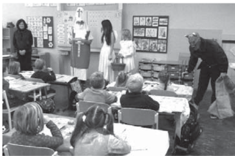
„Do pytle půjdeš, osobo peklu propadlá, bl bl bl bl bl!“

V pátek 5. prosince zavítala do tříd na 1. stupni nebesko-pekelná delegace sv. Mikuláše a jeho pomocníků, jimiž byli dva andělé a strašlivý čert. Vykulené děti sledovaly návštěvu nadpřirozených bytostí s náležitou úctou, zvláště služebník pekla naháněl svým krutopřísným profesionalismem hrůzu těm žákům, kteří nemají zrovna čisté svědomí. Děti svatému muži a jeho asistentům zarecitovaly či zazpívaly písničky a za odměnu