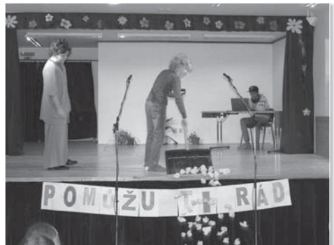
Vtipné scénky připravené členy žákovského parlamentu malé diváky nejen rozesmály, ale také přiměly k zamyšlení.

Na závěr děti dostaly plyšáčky, které si pojmenovaly a uložily na viditelné místo ve třídě. Plyšáci zatím čekají, až si děti navzájem poví, do jaké dobrovolné pomoci se pus-