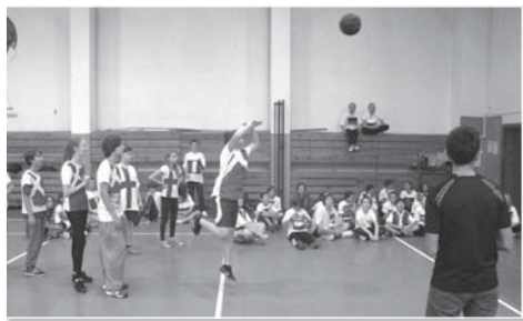
Sportovní štěstí se v závěru nervy drásajícího souboje o druhé místo nakonec přiklonilo na stranu Tre Kronor.

Následujícího dne se žáci rozdělili na přič třídami podle jednotlivých států, vzniklo tedy 9 „národních“ skupin o šesti až sedmi členech. Za svůj stát pak žáci soutěžili ve vědomostních kvízech a dovednostních disciplínách v učebnách zeměpisu a dějepisu, v učebně výtvarné výchovy si vyrobili sportovní dresy svého státu.