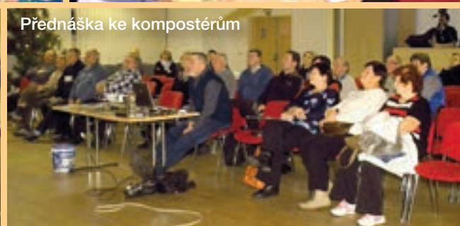
Přednáška ke kompostérům