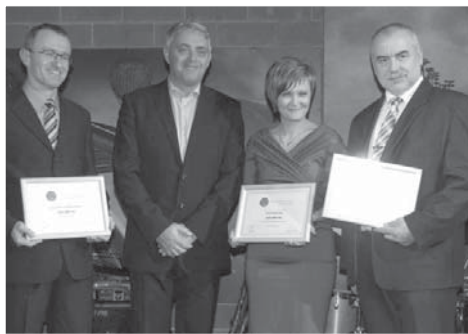
Paní ředitelka přebírá z rukou zástupců společnosti Plzeňský Prazdroj symbolický šek v hodnotě 380 tisíc korun.