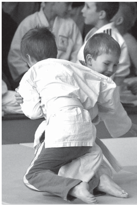
Nejmenší děti z Dobré patří k budoucím nadějším českého juda.

Díky výborné spolupráci se mohou členové klubu připravovat také na základnách v Raškovcích, Skalici a Na Bahně FM, což přináší možnost až pěti tréninkových jednotek v týdnu. Základna v Dobré je pilířem seskupení regionálních oddílů juda. Ve výborné spolupráci s mateřskou školkou v Dobré již druhým rokem s úspěchem provozujeme kroužek nejmenších dětí, které se zábavnou formou učí zejména základům gymnastiky a juda.