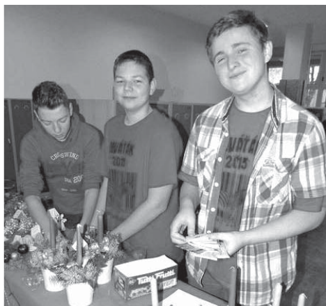
Naše stánkaře zdobil vždy ten pravý vánoční úsměv.