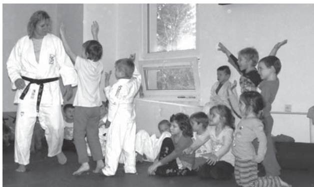
Kroužek juda mateřské školky navštěvuje 27 budoucích žáků doberské základní školy, které se zde zdokonalují především v základech gymnastiky.