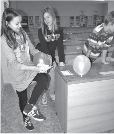
V učebně fyziky děti předváděly udivenému obecnstvu pozoruhodné experimenty hraničící s černou magií. Ba ne, všechno je to věda.

atmosféry. Mnohé předměty vyrobily samy nebo s pomocí rodičů. Třídní kolektivy si demokraticky rozhodnou, jak vydělané peníze utratí, většinou si však těžce nabyté korunky vloží do třídního fondu.