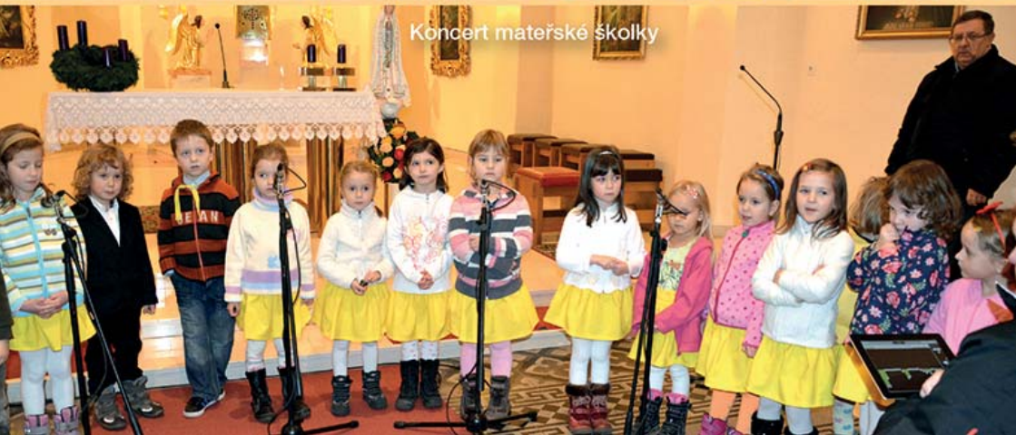
Koncert mateřské školky