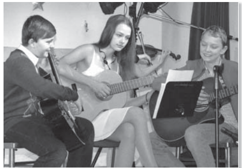
Je až neuvěřitelné, kolik nadaných hudebníků na naší škole máme.