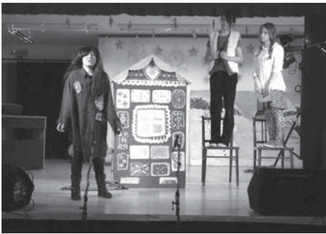
Humorné ztvárnění klasické pohádky O perníkové chaloupce diváci odměnili zasluženým potleskem.

kominu v podobě tvarohových a makových koláčů (výborných!) nabízely paní kuchařky u vstupu do školní jídelny. Kdo utišil hlad, žízeň a nákupní horečku, mohl se projít po škole a prohlédnout si třídy a odborné učebny, ve kterých probíhal různorodý program pro návštěvníky.