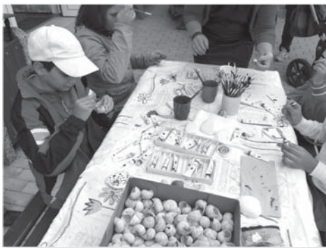
Během otevřeného odpoledne si mohli malí návštěvníci např. vybarvit hlemýžď ulitu či kamínek.