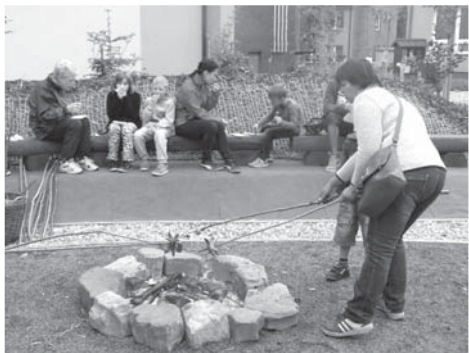
K dobré náladě přispělo i opékání špekáčků.

Odpoledne se nová školní zahrada otevřela široké veřejnosti. Rodiče a děti si mohli prohlédnout nové venkovní prostory, zatsoutěžit si nebo si namalovat 3D obrázek či vybarvit kamínek a konečně se také občerstvit opečeným párkem či sladkým pečivem. Doplňující program probíhal na dopravním hřišti, kde se malí návštěvníci mohli vyřádit na kolech a koloběžkách. Reakce hostů byly velmi pozitivní a škola i obec může být právem hrdá na to, že Dobrá je opět lepším místem k životu i ke studiu. Přišel také Karel Čapek. Posadil se na chvíli k ohni, prohlédl si se zasněným pohledem okrasné keře a bylinkové zahrádky, přečetl si všechny informační tabulky a nakonec nad párkem