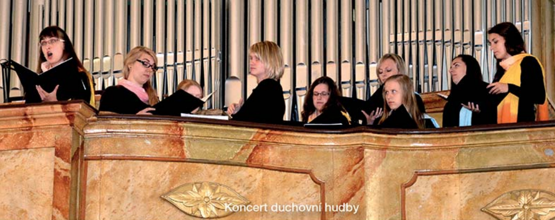
Koncert duchovní hudby