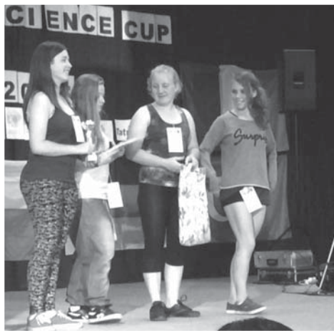
Děvčata během vyhlášení výsledků neskrývala svou radost z úspěchu.