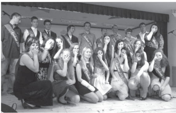
Žáci 9. B se rozloučili se školou se svým typickým humorem, kterým pohládili po duši všechny diváky.

pak pochutnali na slavnostním obědě, který pro ně naposled připravily paní kuchařky. Děkujeme našim devátákům za všechnu práci, kterou během studia na naší škole od-