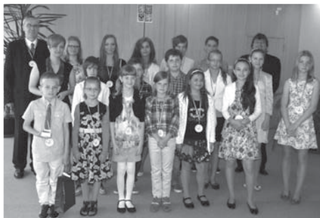
Ocenění žáci s medailemi na krku hrdě pózuji po boku paní ředitelky a vedení obce.

Vyznamenané žáky na úřadě přivítal svým proslovem pan starosta s panem mís-