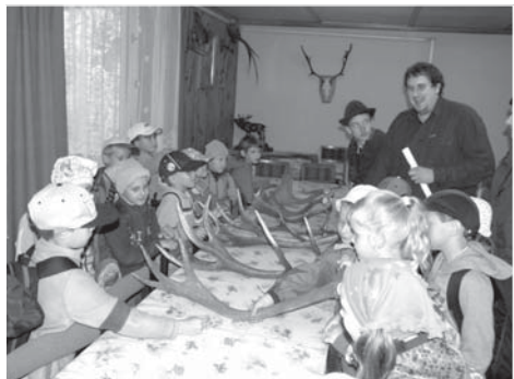
Děti na myslivecké chatě obdivují lovecké trofeje.

Ve čtvrtek 18. června uspořádali členové mysliveckého sdružení VRCHY Dobrá – Pazderna již tradiční jedenáctý ročník Dětského dne s myslivci.