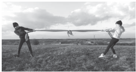
Součást fotografické kolekce Šátky Veroniky Válkové.

Umělecké sdružení Art Collegium Foto-klub Frýdek-Místek vyhlásilo v letošním roce fotografickou soutěž pro mladé autory. Soutěže se se svými fotografiemi zúčastni-