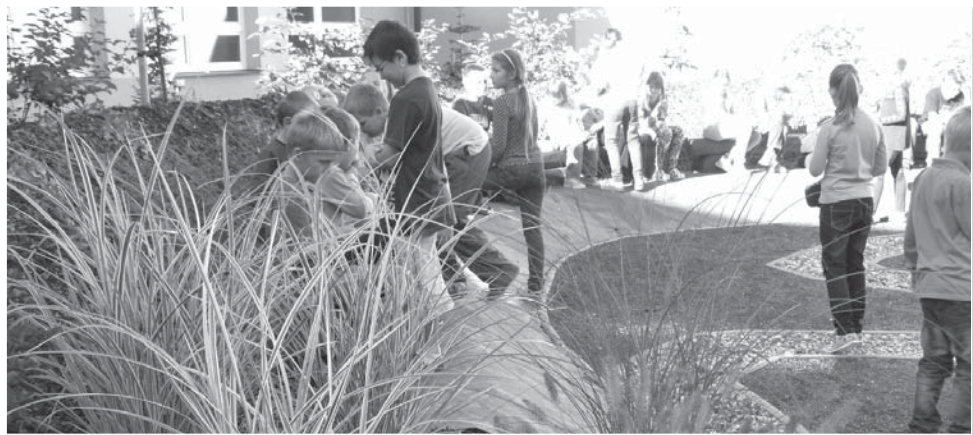
Ve školním atriu děti netráví jen přestávky, ale také pracují na různých školních projektech, nebo se zde věnují skupinové práci v rámci běžného vyučování.