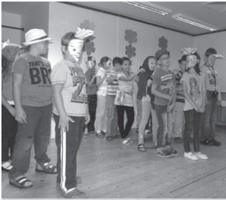
Anglicky hraná pohádka O veliké řepě sklídila zasloužený potlesk malých diváků.

aby malí začátečníci bojující s nástrahami angličtiny dostali další motivaci ke studiu a nahlédli na angličtinu také z jiných úhlů pohledu, na které v běžné výuce často nezbývá čas a prostor. Vrcholem Evropského dne jazyků na 1. stupni pak byla anglicky hraná pohádka O veliké řepě, kterou pro své spolužáky z 2. až 5. ročníků předvedli malí herci z 3. A.