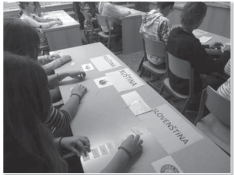
Co jen mají ty jazyky společného? Člověk se ani nenaděje a umí polsky!

Tentokrát se nám podařilo skloubit program tak, aby se mohly v jeden den zapojit děti na 1. i 2. stupni. Pro žáky 4. a 5. tříd si jejich paní učitelky připravily zábavný výukový program plný her a soutěží, který byl zaměřen především na anglický jazyk,