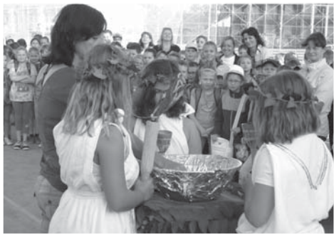
Řecké bohyně zapalují olympijský oheň. Poznámka pro dobrovolné hasiče – oheň na pochodni není skutečný ☺.

Olympijský oheň vzplál a zápolení ve čtyřech hlavních sportovních disciplínách mohlo začít. Soutěžilo se v běhu na 60 m, hodů kriketovým míčkem, skoku do dálky, vytrvalostním běhu. Sportování se zúčastni-