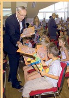
Vítání žáků první třídy