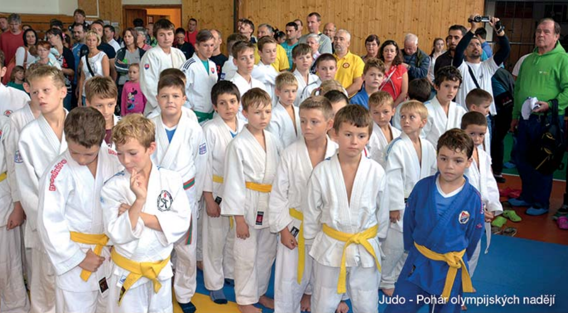
Judo - Pohár olympijských nadějí