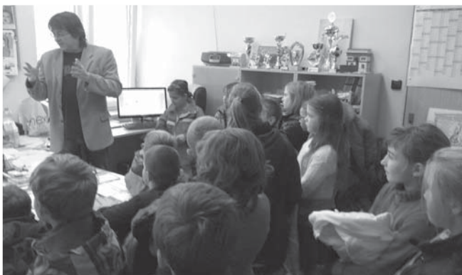
Děti při své návštěvě obecního úřadu diskutovaly s panem místostarostou o svých návrzích na zlepšení života v obci.