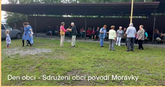
Den obcí - Sdružení obcí povodí Morávky