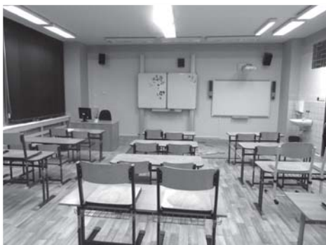
Nová kmenová třída v místě bývalé odborné učebny anglického jazyka.

Pokračovali jsme také v zpříjemňování vnitřního prostředí školy a díky podpoře Klubu rodičů vznikl na chodbě u přírodopisné učebny ekokoutek, ve kterém budou žáci trávit nejen přestávky, ale plnit i projektové úkoly.