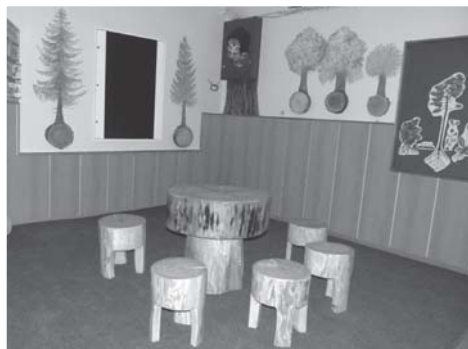
Ekokoutek na chodbě poblíž učebny přírodopisu.

přírody v umění aneb otevřená škola“, který vzniká za podpory Nadačního Fondu Hyundai a Nadace Open Society Fund Praha. Naše výtvarnice budou realizovat 5 rukodělných děl pro žáky a jejich rodiče, či prarodiče.