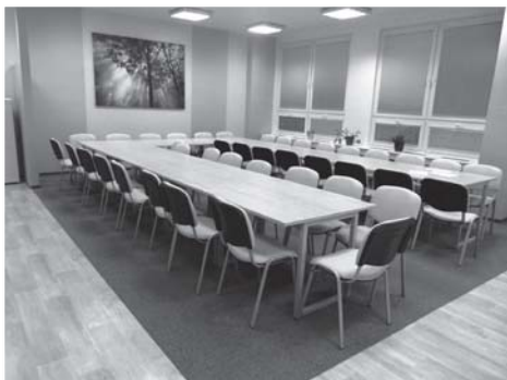
Nová sborovna je laděna do klidných barev.