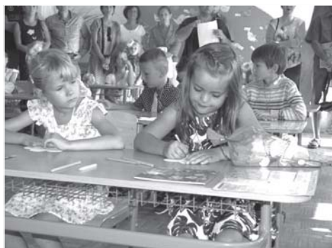
Pan starosta podělil prvňáčky krásnými knížkami, v nichž si již budou moci sami číst.