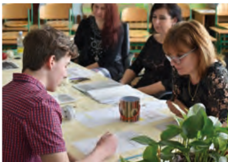
Čelit zkušební komisi si žádá pevné nervy a chladnou hlavu.

V době, kdy vychází tento článek, již mají devátáci za sebou přijímací zkoušky na střední školy a před nimi je další krok na cestě za vysněným vzděláním. Děkujeme jim všem za poctivou školní práci a přejeme jim, aby se v budoucnu dokázali vypořádat s každou