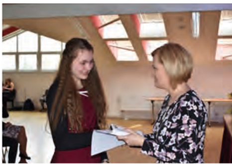
Při přebírání maturitního vysvědčení už naši devátáci nešetřili úsměvy.

životní zkouškou stejně tak dobře jako s malou maturitou na naší škole.