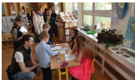
Budoucí prvňáčci si mohli během zápisu připadat jako v pohádce.

Na budoucí prvňáčky čekalo v tento důležitý den plnění různých úkolů s tématem pohádky O perníkové chaloupce. S překonáním