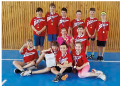
Naši malí sportovci se na frýdecko-místeckém turnaji radovali ze zlatých medailí.

Tím však výčet úspěchů v této kolektivní hře nekončí. Že jsou malí sportovci letos skutečně ve výborné formě, dokázali dubnu ještě jednou, a to na již tradičním přátelském utkání ve vybíjené „O velikonočního beránka“, pořádaném už bezmála 20 let naší školou pro základní školy okolních obcí. V krásné sportovní atmosféře se utkalo