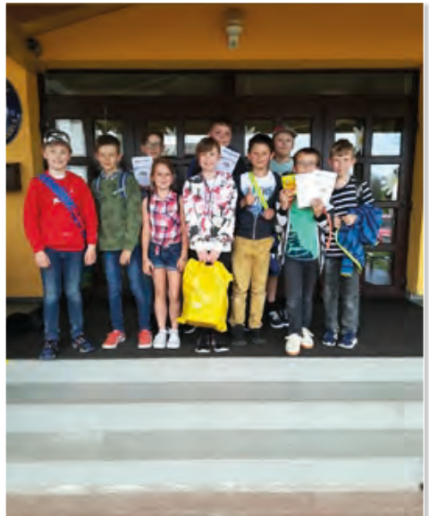
Naši šachisté si turnaj velice užili.