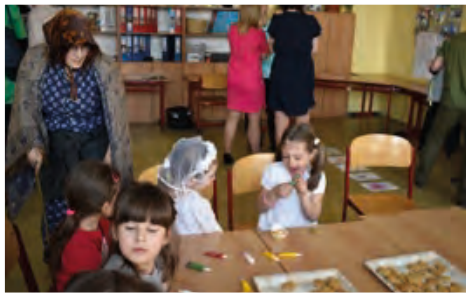
Nechyběly ani perníčky a ježibaba.

Pro naše budoucí žáčky začíná škola „na-nečisto“ už 9. května v rámci prvního setkání metody dobrého startu, která jím usnadní adaptaci na naši školu. Od 1. září otevíráme dvě první třídy, pro které bude vybudováno nové zázemí v současných odděleních školní družiny ve „staré“ škole. Dopoledne budou tyto třídy sloužit prvňáčkům a odpoledne v nich najde své útočiště školní družina. Současně proběhne také rekonstrukce kabinetů