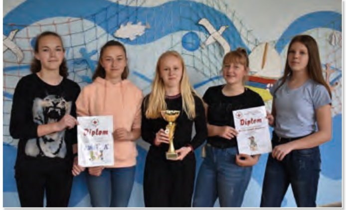
Vítězný tým mladých zdravotnic reprezentoval naši školu na výbornou.

Naše děvčata obstála v tvrdé konkurenci na výbornou a slavně obsadila 1. místo, které jim zaručuje postup do krajského kola soutěže, jež proběhne 8. června v Opavě. Holky získaly za svoje vítězství pohár, diplomy a věcné ceny. Blahopřejeme a věříme, že v krajském kole znovu předve-