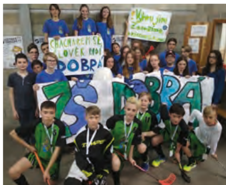
Naši florbalisté i se svými fanoušky na turnaji krásně reprezentovali doberský sport.