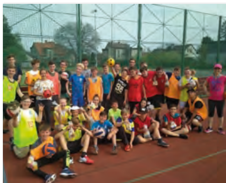
Sluníčko se schovalo za mraky, ale rozzářené tváře hráčů vybíjené rozsvítily celé sportovní odpoledne.