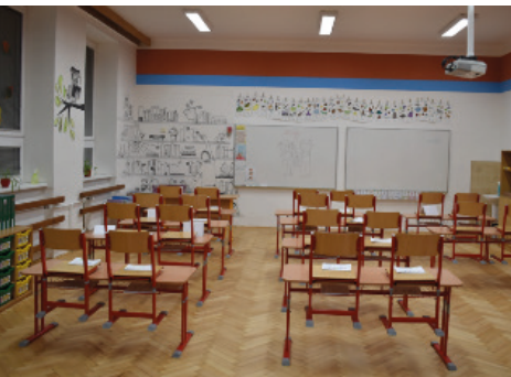
Třída pro prvňáčky

Během prázdnin se pilně pracovalo u tělocvičen, kde proběhla oprava celkového zázemí, byly zrekonstruovány toalety u tělocvičen a školní jídelny a opraveny kanalizační svody.