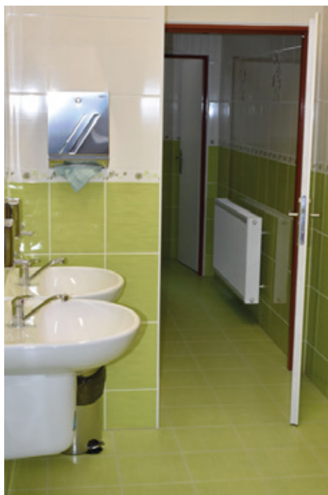
Nové zázemí u tělocvičen