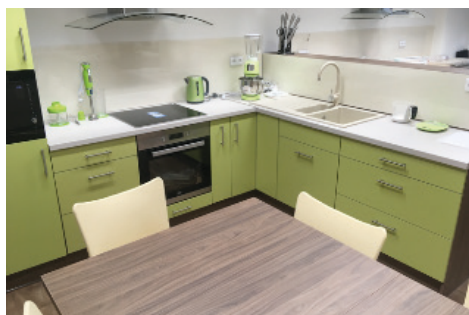
Nová cvičná kuchyňka