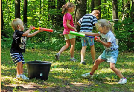
DĚTSKÝ DEN MECHULE