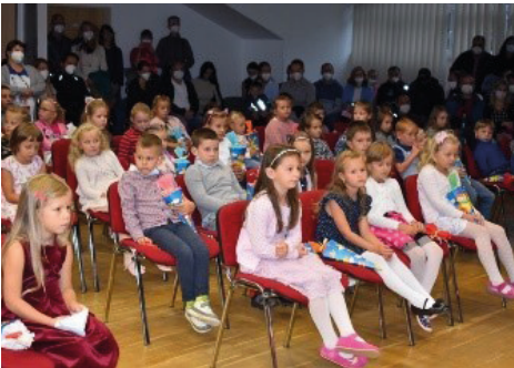
Slavnostní přivítání prvňáčků

Ta totiž o prázdninách opět zkrásněla. Několik měsíců probíhala celková rekonstrukce učeben cvičné kuchyně a školní dílny, které nyní odpovídají požadavkům moderní doby a jsou zcela nově vybaveny veškerým náradím a učebními pomůckami. Také jsme školu vybavili po technické stránce, realizovali konektivitu, nakoupili notebooky, iPady a některé třídy dovybavili dataprojektory. To vše bylo umožněno díky našemu zapojení do projektu „Rekonstrukce odborných tříd a konektivita školy“, kdy celkové finance přesáhly přes 3,5 mil. Kč, ale také díky státní podpoře a finanční podpoře našeho zřizovatele.