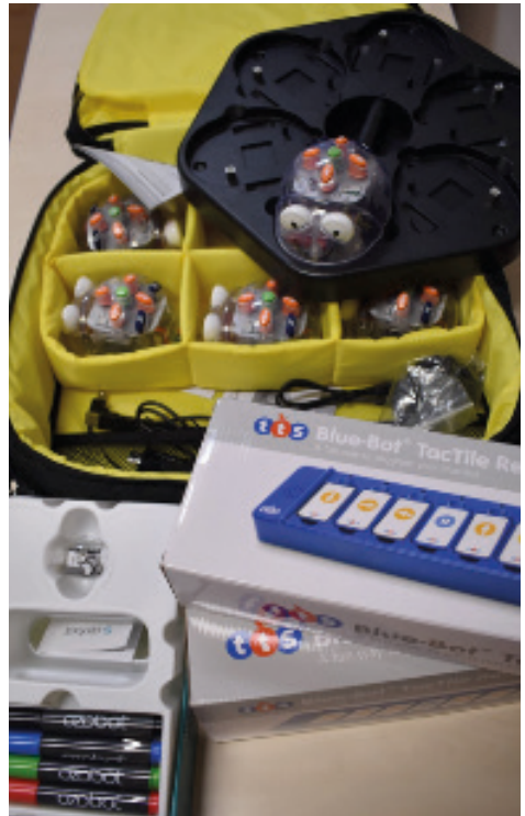
Pomůcky pro robotiku

My učitelé jsme připraveni v letošním roce žákům poskytnout maximální podpo-