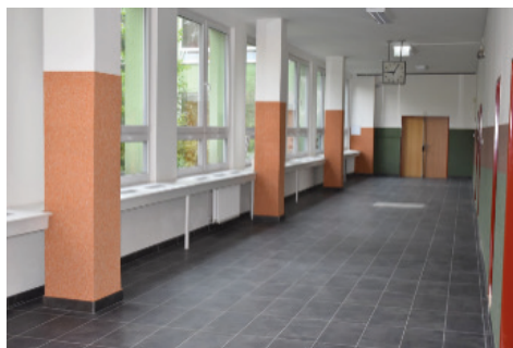
Nové zázemí u tělocvičen