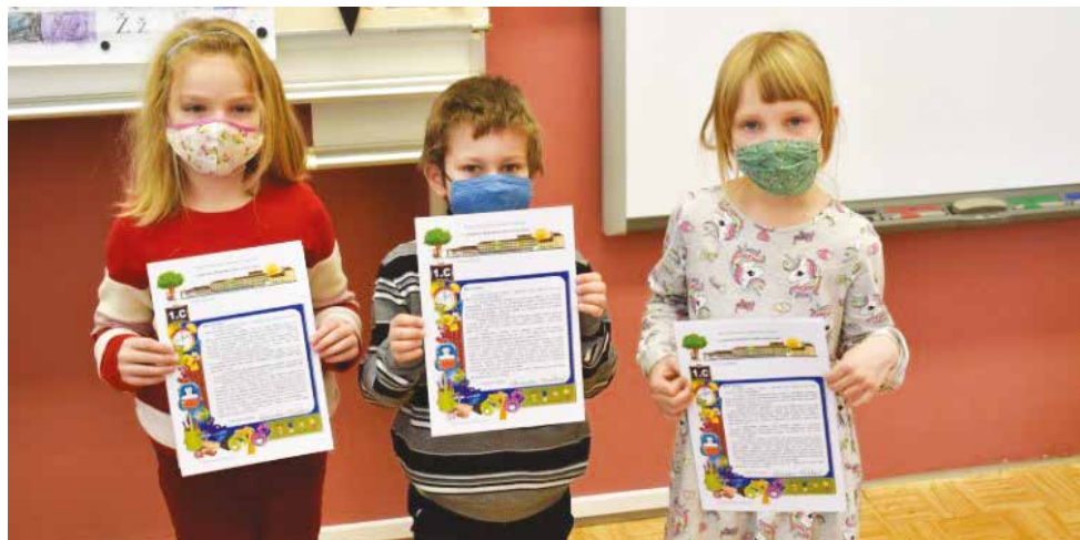
K výpisu vysvědčení žáci dostali doprovodný dopis paní učitelky