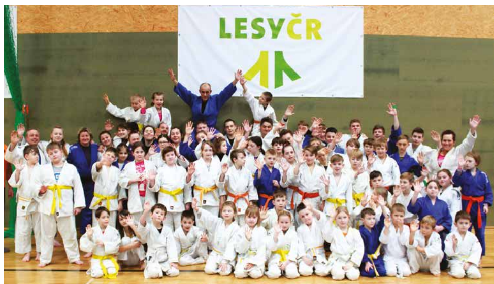
V roce 2020 jsme stihli zvítězit v krajském přeboru žactva

způsobu života, který v konečném výsledku může vést k obezitě a civilizačním chorobám. V dnešní době dvakrát platí Tyršovo heslo „Ve zdravém těle zdravý duch.“ Zmysleme se proto především my dospělci, kam chceme vést své děti. I v současné nelehké době nabádejme mládež k intenzivnímu