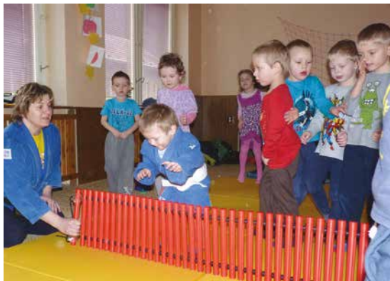
2013- dnes už to jsou školáci