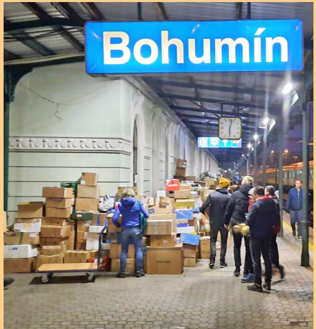
Sbírka pro Ukrajinu