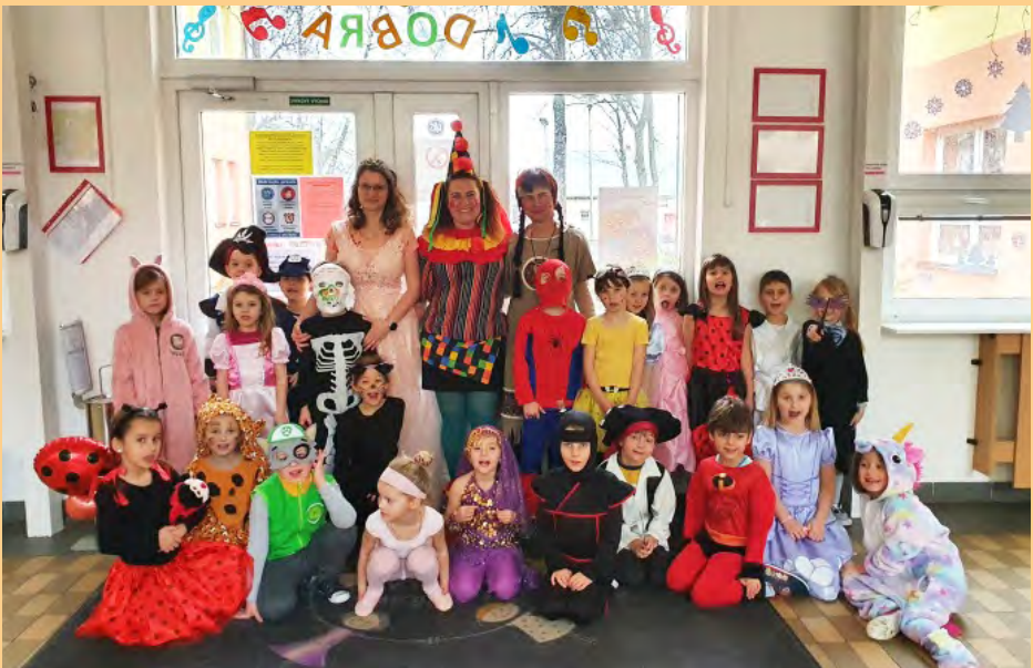
Karneval v MŠ