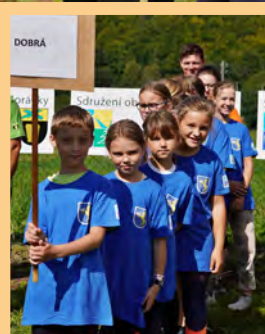
Sportovní den SOPM