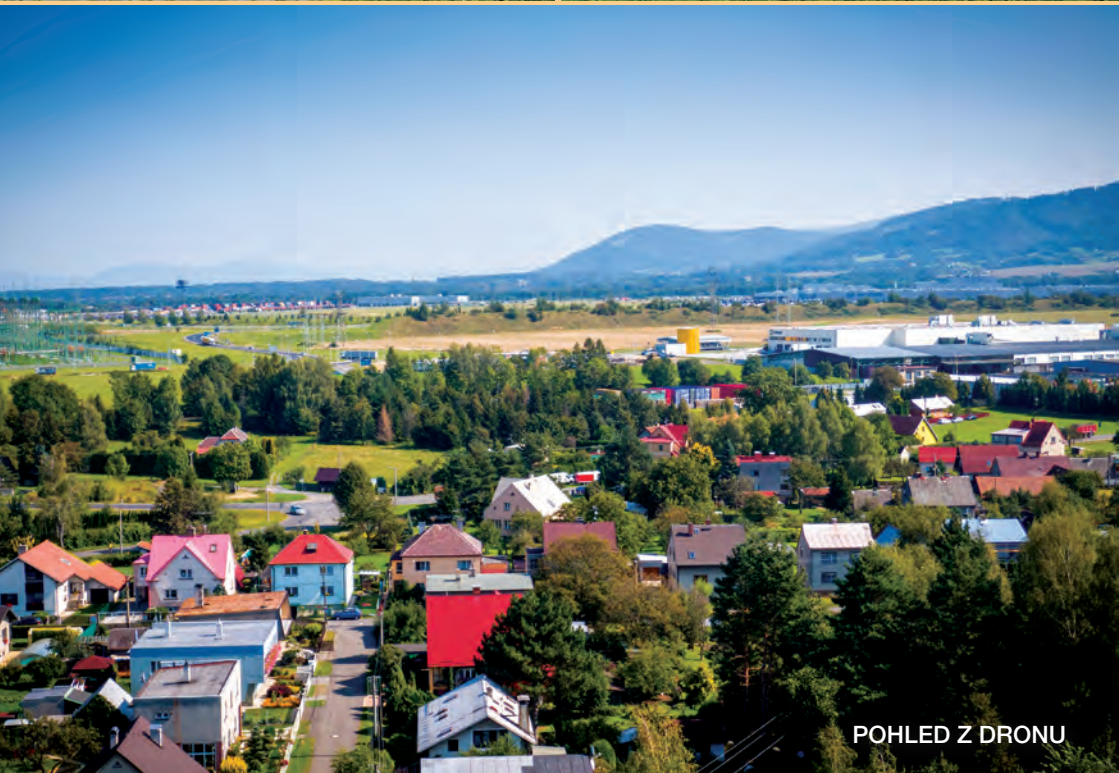
POHLED Z DRONU