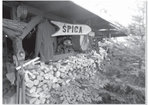
Cíl pochodu je dán jasně

Několikrát už byla zmíněna vazba k naší základní škole. Tak jak to tedy bylo? S úsměvem říká, že do školy v Dobré šel v roce 1952 jako prvňák a za dalších patnáct let se tam vrátil jako učitel. Jeho sestra tehdy chodila