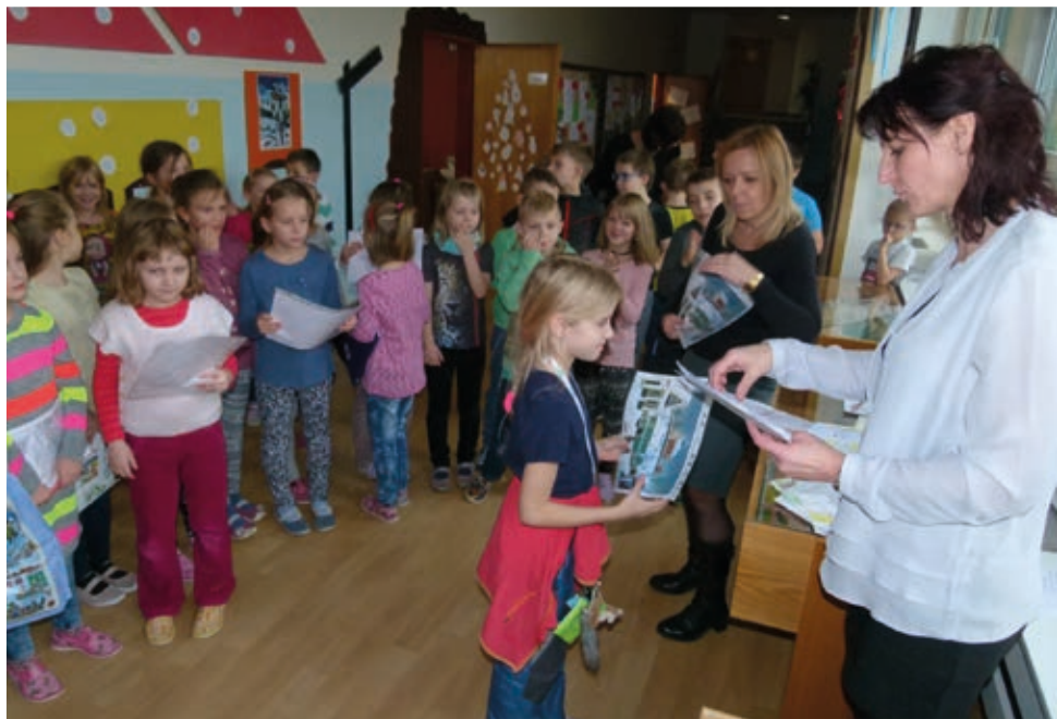
Malí výtvarníci získali za svoje krásné obrázky pěkné ceny.