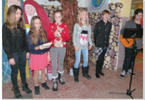
Žáci 6. C vítali všechny milé hosty zpěvem koled.

Kdo toužil po zábavě ze soudku umění, zamířil do školního sálu, kde proběhla dvě představení pro veřejnost. Letos naši měli herci, zpěváci a muzikanti nastudovali diva-