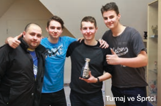
Turnaj ve Šprtci