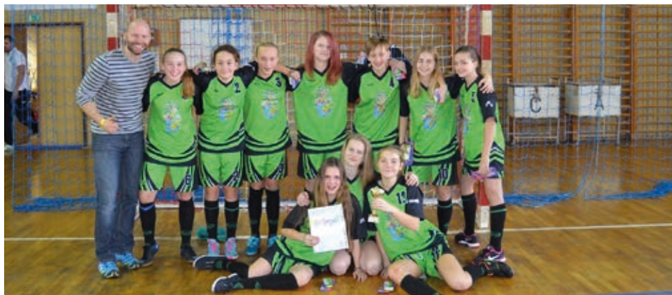
Naše reprezentantky bojovaly jako lvice a dosáhly na skvělé stříbro.