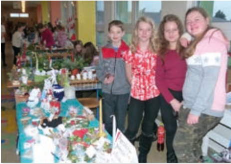
Stánky jednotlivých tříd překypovaly rozkošnými vánočními drobnostmi.

delní představení na motivy známé televizní pohádky Anděl Páně. Bravurní herecké výkony doprovázela hudební a pěvecká čísla a diváci zaslouženě ocenili vystupující bouřlivým potleskem.