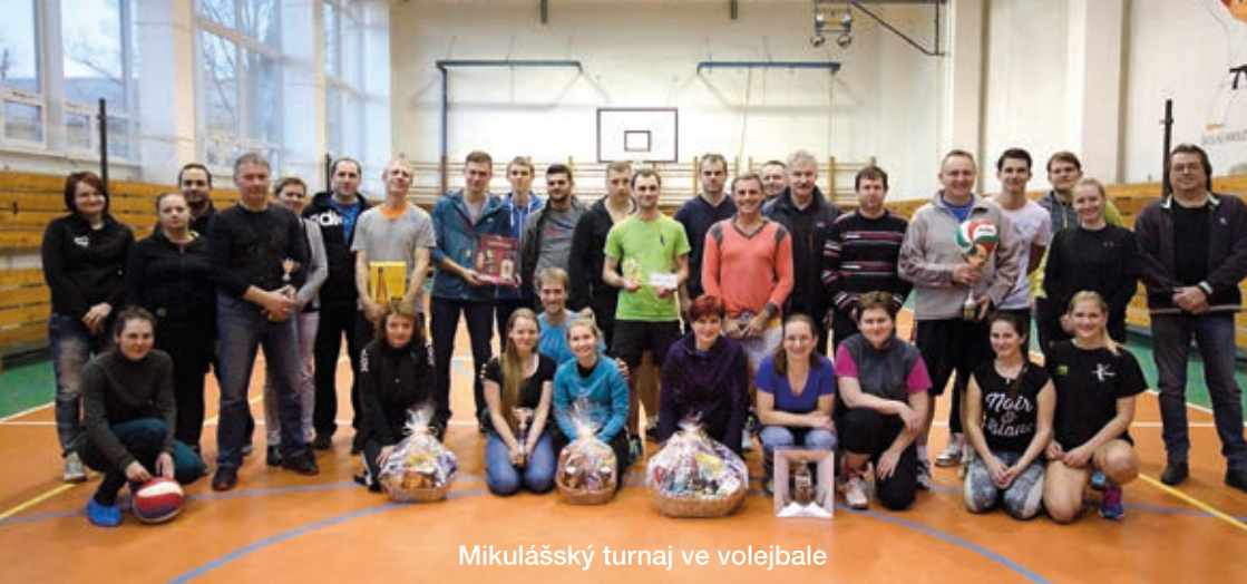
Mikulášský turnaj ve volejbale