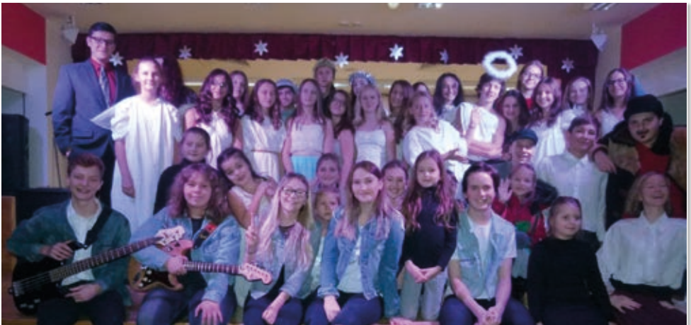
Naše veselá divadelně-hudební společnost měla z diváckého úspěchu velkou radost.