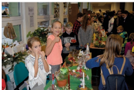
Děti si v roli jarmarečnických prodejců velice líbovaly.