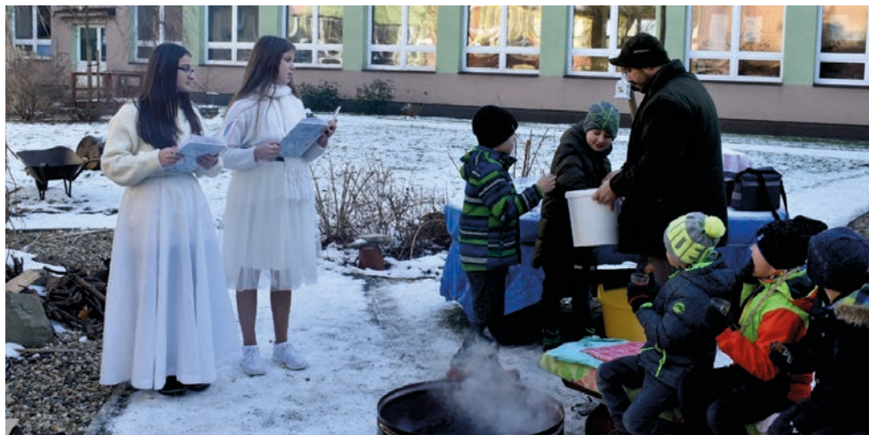
Zimní čtení v atriu je oblíbenou předvánoční akcí pro děti 1. stupně.