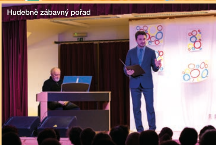
Hudebně zábavný pořad