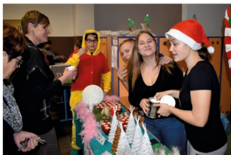
Vánoční jarmark navštívil i Medvídek Pú.