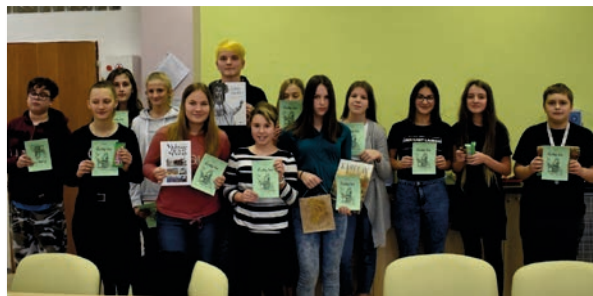
Mladí historikové si odnesli také pěkné diplomy a sladkou odměnu.