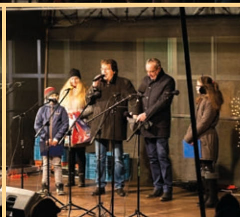
Rozsvěcování vánočního stromu