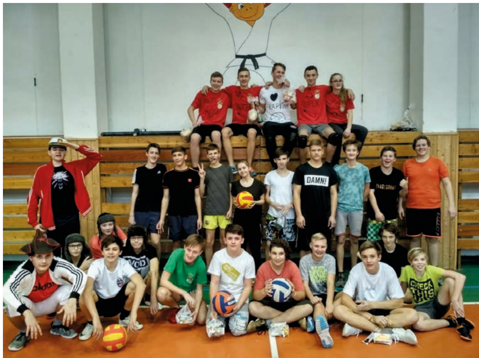
Dodgeball se těší mezi žáky velké oblibě.