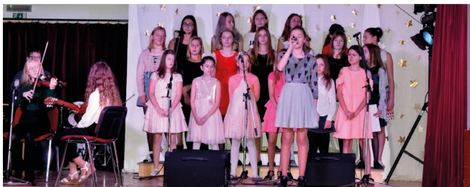
Diváci s velkým nadšením tleskali skvělým hudebním číslům.