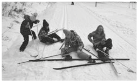
Žádný učený z nebe nespádl, proto nás dobrotivý Pánbůh vybavil zadnicí.