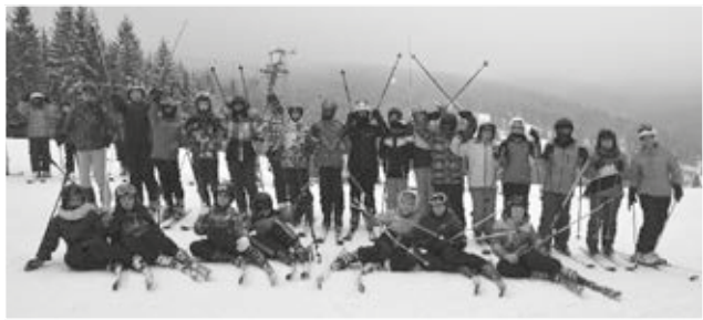
Žáci druhého kurzu v plné lyžařské polní.

Žáci po celé oba kurzy bojovali o ceny pro nejlepšího lyžaře a lyžařku. Nehodnotily