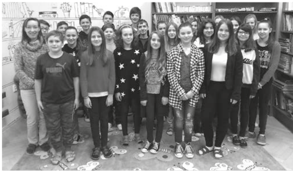
Děti, které se účastnily soutěže v anglické konverzaci, si anglické dopoledne velice užily.