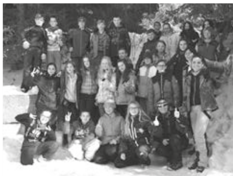
Účastníci prvního kurzu si pobyt na horách velice užívali.

Žáci byli rozděleni do tří výkonnostních družstev. Pod vedením zkušených lyžařských instruktorů z řad učitelů se žáci učili lyžařským dovednostem. Odpolední program byl