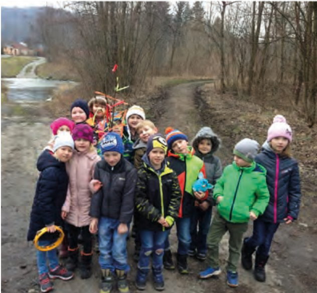
Děti vynesly Morenu, snad tedy už nenasněží.