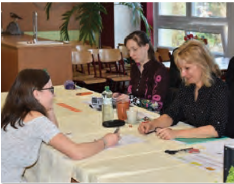
Zkoušení žáci předvedli obsáhlé znalosti a dovednosti.