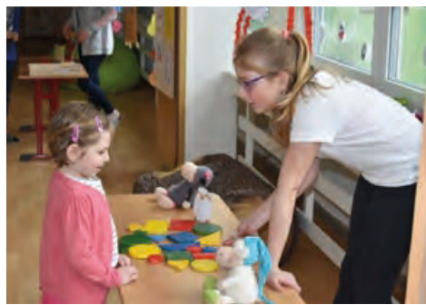
Budoucí prvňáci si během zápisu krásně vyhráli s našimi páťáky.

Letošní zápis do 1. tříd proběhl ve čtvrtek 5. dubna. Nesl se v duchu známé pohádkové bytosti ovečky Shaun. Na děti čekala stezka plná zajímavých úkolů, při jejichž plnění jim