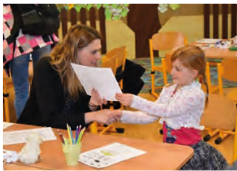
„Už se do školy moc těším, paní učitelko.“