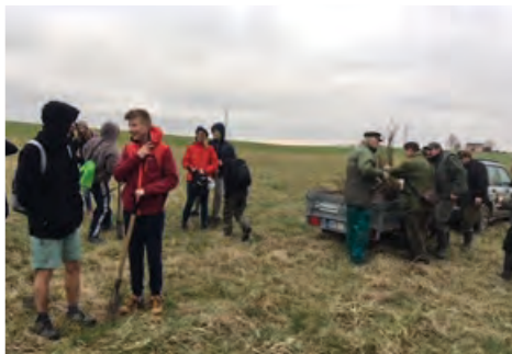
Sázení stromků může být i zábava.

Šli jsme cestou dlouhou, spolu s naší touhou, sádit stromky, stromečky, na nedaleké mezičky. Švestka, svída, ptačí zob a motykou kopy, kop. Mirabelka, dub a lípa a hned nám tu hlína lýtá. Myslivci nám pomohli a hned jsme byli hotovi. Oplatky a pitíčka, zahrála nám srdíčka. Všem myslivcům děkujeme a příště opět pomůžeme!