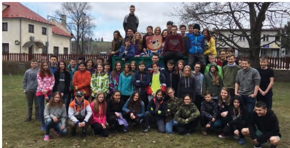
Všichni pracovníci se na konci projektového dne spokojeně usmívali.

Šli jsme cestou dlouhou, spolu s naší touhou, sádit stromky, stromečky, na nedaleké mezičky. Švestka, svída, ptačí zob a motykou kopy, kop. Mirabelka, dub a lípa a hned nám tu hlína lýtá. Myslivci nám pomohli a hned jsme byli hotovi. Oplatky a pitíčka, zahrála nám srdíčka. Všem myslivcům děkujeme a příště opět pomůžeme!