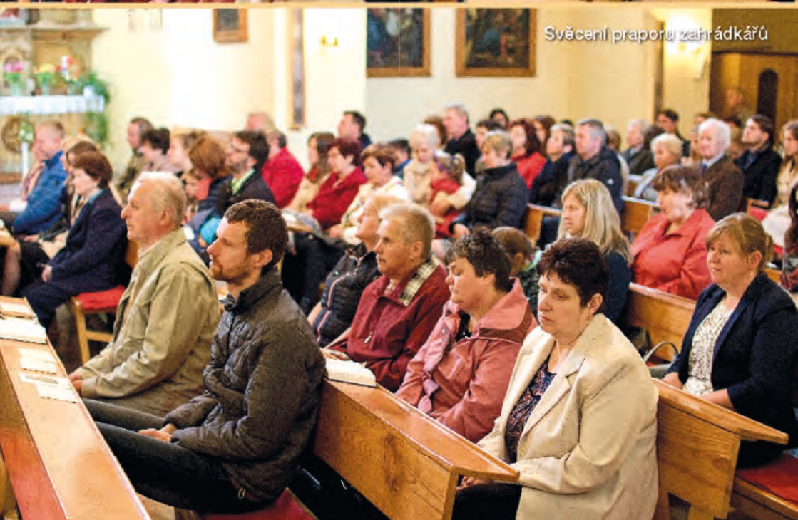
Svěcení praporu zahrádkářů