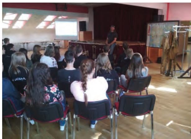
Český indián naše žáky velmi zaujal.