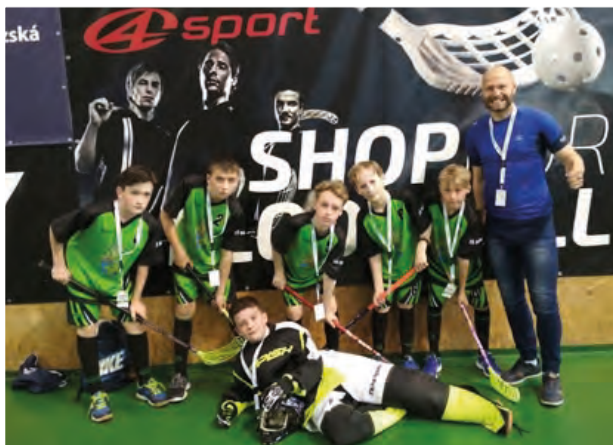
Našemu florbalovému týmu nepřál los, ale přesto jsme reprezentovali s chutí.