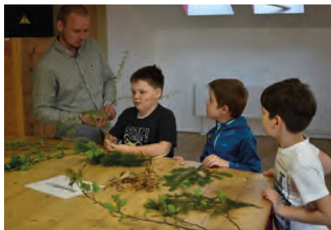
Povídání o lese zvidavým žákům otevřelo dveře k poznávání přírody.