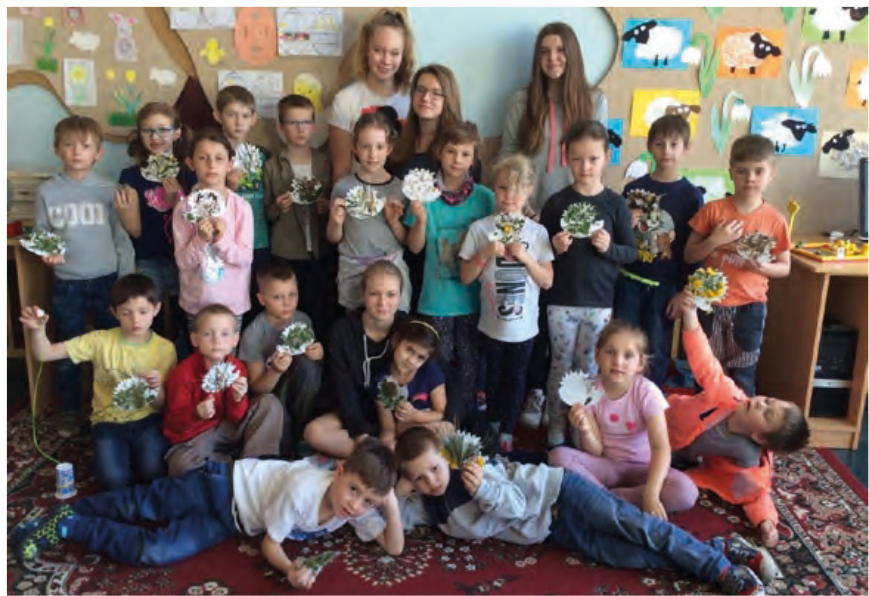
Mladším žákům se velmi líbilo, že jejich učitelé se na chvíli stali žáci 8. ročníku.