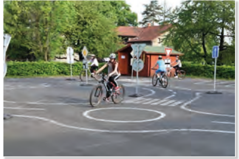
Na našem dopravním hřišti je stále živý provoz.

Na dopravním hřišti pořádáme pravidelně praktické výcviky pro žáky i ve spolupráci s Městskou policií z Frýdku-Místku. V dubnu měli žáci 5. ročníku projekt Doprava kolem nás. V rámci projektu si zopakovali, co všechno se během výuky dopravní výchovy na 1. stupni naučili. Svě vědomosti a dovednos-