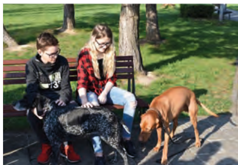
Nejoblíbenějším stanovištěm byly pochopitelně cvičení psi.