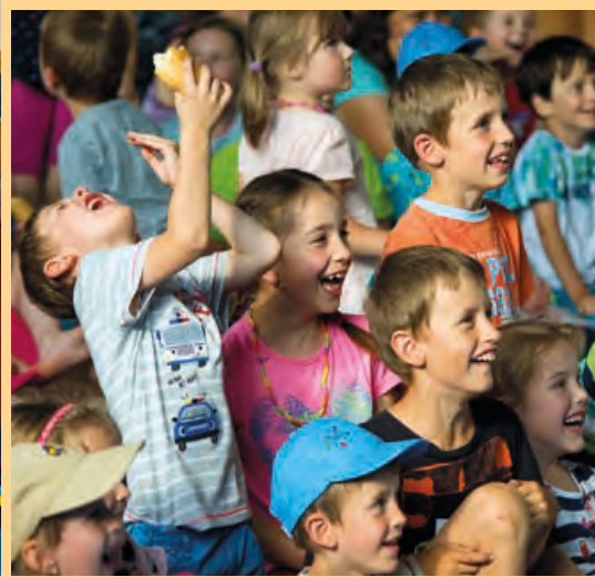
Šerpování žáků v ZŠ