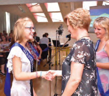
Vyznamenání nejlepších žáků