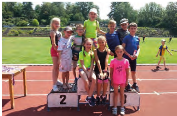
Naši malí atleti nám ostudu rozhodně neudělali.

Ve středu 20. června se konalo ve Frýdku-Místku okresní kolo atletického trojboje pro 1. stupeň. Naši školu reprezentovalo družstvo 10 sportovců 1. - 5. ročníku.