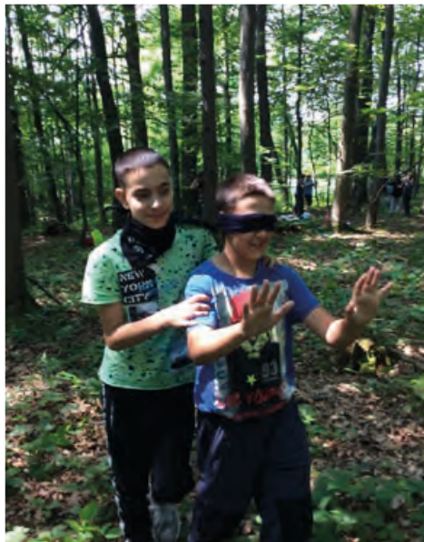
Dobrodružné aktivity v lese žáky velmi pobavily.