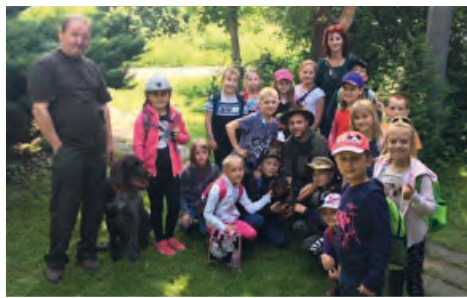
Myslivečtí psi si získali zaslouženou pozornost dětí.

V pátek 15. 6. 2018 se žáci 1. – 3. tříd vydali k nedaleké myslivecké chatě vstříc lesnímu dobrodružství. Plnili různé úkoly, poznávali