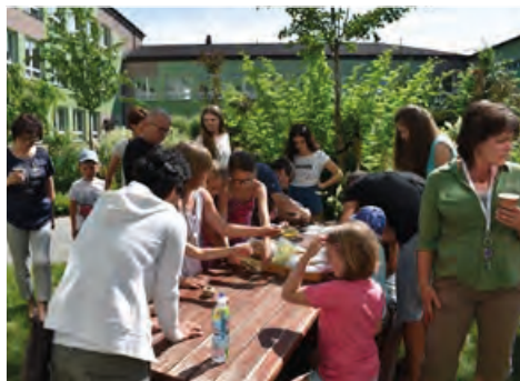
Výtvarné workshopy přitáhly mnoho spokojených návštěvníků.

Ve čtvrtek 8. června odpoledne se opět po roce otevřely brány naší školy dokořán pro všechny dobré lidi z okolí, kteří mohli přijít do našeho školního atria a společně se svými