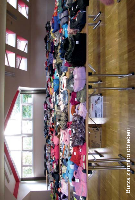
Burza zimního oblečení