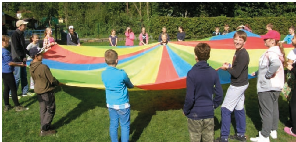
Zábavné aktivity kladly důraz na týmovou spolupráci a děti se výborně bavily.