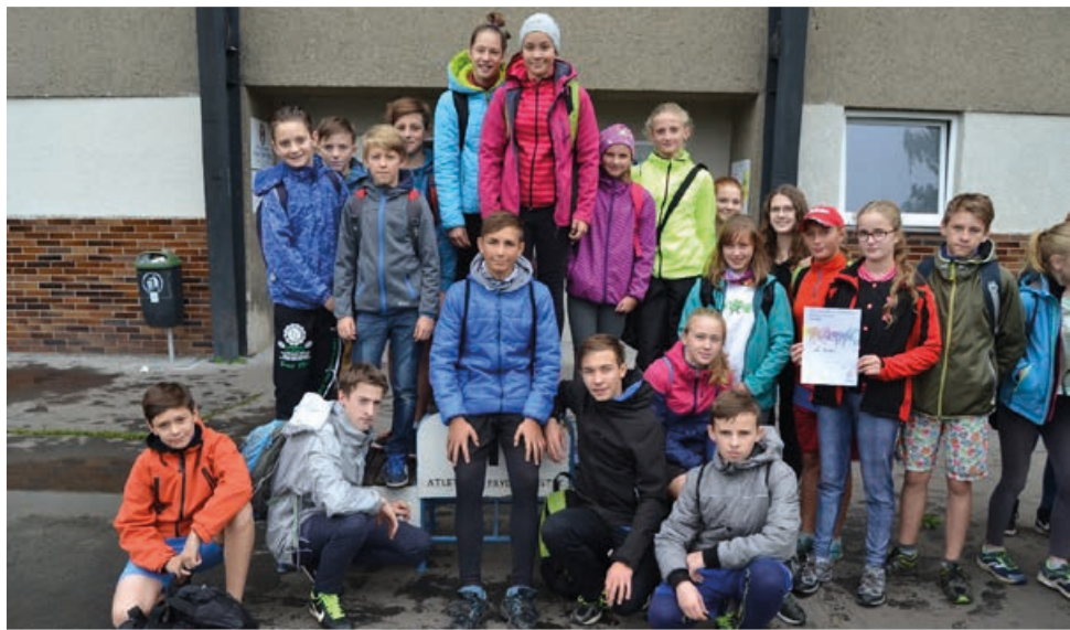
Úspěšná výprava našich reprezentantů v okresním kole přespolního běhu.