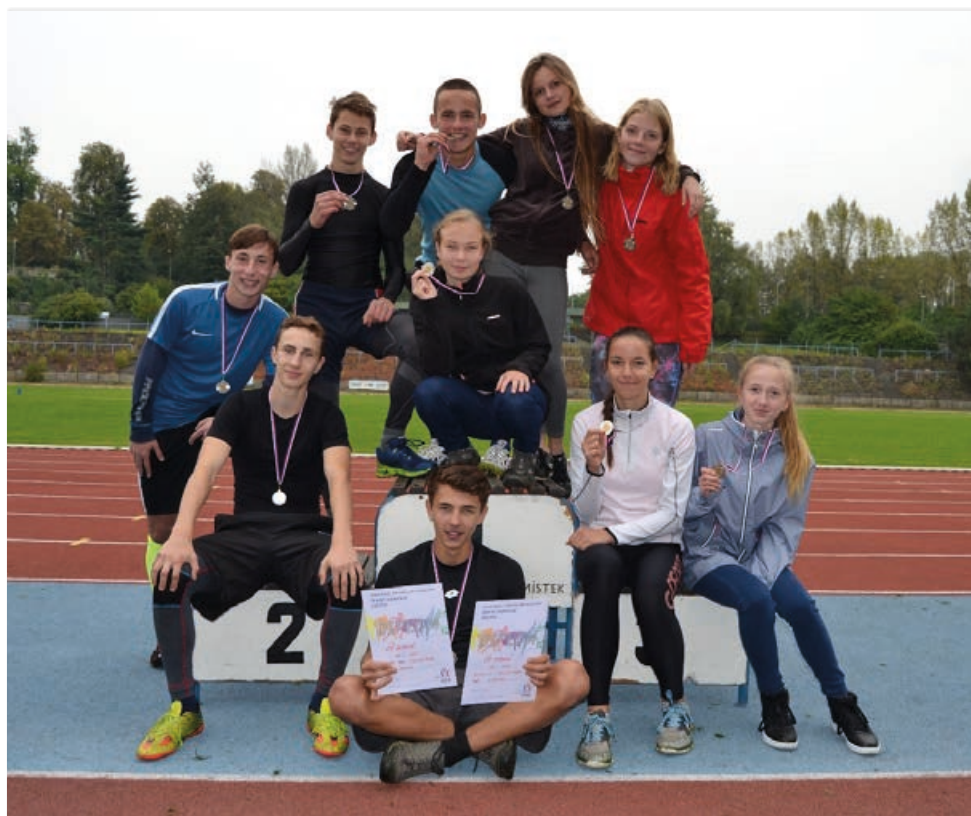
Naši atleti dokázali, že v Dobré umíme bojovat a vítězit.