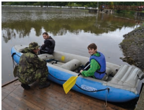
Jízda na raftu patřila k nejzajímavějším disciplínám.

Naše škola po vítězství v oblastním kole, které se konalo v květnu tohoto roku, postoupila společně s dalšími 18 školami ze všech okresů Moravskoslezského kraje do krajského finále, které se konalo ve vojenském výcvikovém prostoru Libavá – výcvikové středisko přehrada Barnov. Za typicky vojenského počasí soutěžilo naše družstvo v rozličných disciplínách, např. jízda na raftu, bojová dráha, střelba ze vzduchové pušky, vědomostní test na téma Ostravská operace, první pomoc, silové testy s pneumatikou, běh v terénu a další.