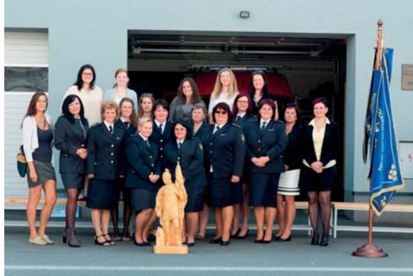
125. výročí založení SDH Dobrá