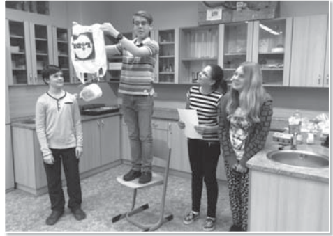
Chvilke napětí – zachraň MacGyverův padák padající vejce?

více se dětem líbila záchrana vejce. Pěkná spolupráce, zájem a chuť si projekt zopakovat je pro vyučující vždy největší odměnou. Tímto děkujeme dětem za zapojení do dobrovolného projektu a doufáme, že děti budou i nadále pohlížet na fyziku jako nesmírně zajímavou a inspirativní vědu.