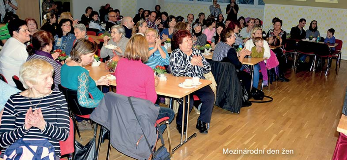
Mezinárodní den žen