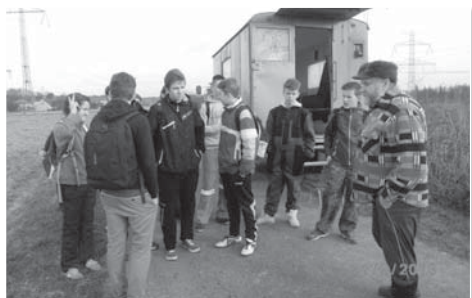
Naši devátáci přiložili ruku k dílu a pomohli myslivcům s péčí o mladé stromky.

Ve čtvrtek 31. března 2016 proběhl jako každoročně ročníkový projekt devátáků „Člověk a jeho vztah k životnímu prostředí v obci“. Tento projekt učí žáky vnímat přírodu nejen svými smysly, ale je ryze pracovní. Žáci pomáhají zkrášlovat přírodu v obci a také v okolí naší školy.