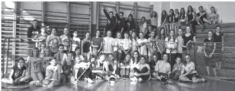
Dívky se do hry pustily se zápalom, avšak v duchu fair play.