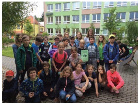
Čtvrtákům se projekt Voda moc líbil a odnesli si mnoho zážitků

na deseti naučných tabulích v lužním lese řeky Morávky a trasa pokračovala i vrchem Skalická Strážnice, ze kterého jsou pěkné výhledy do krajiny a na panorama Beskyd.