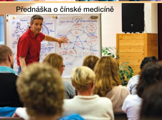
Přednáška o čínské medicíně