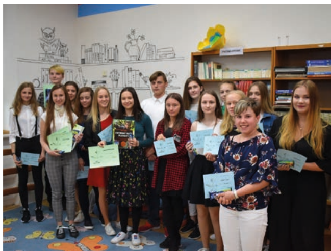
Naši mladí řečníci se ve světě rozhodně neztratí