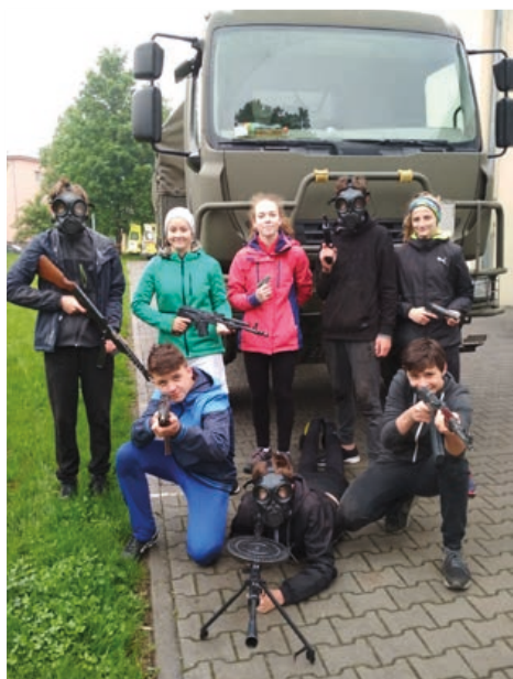
Oba naše týmy předvedly na branné soutěži Wolfram nepřekonatelné výkony

15. května se konal 4. ročník branného závodu pod názvem Wolfram. Akce je organizována Armádou České republiky – Krajským vojenským velitelstvím Ostrava. Závod je pojmenován a inspirován největším paravýsádkem za II. sv. války, který se kdy uskutečnil