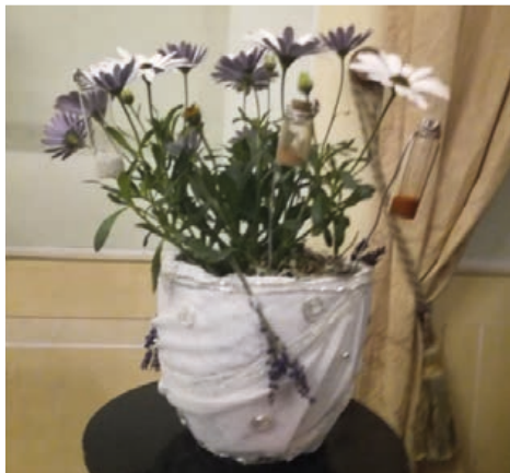
Přizdobá hrmkové květiny pro Bílou královnu – A. Gregorová