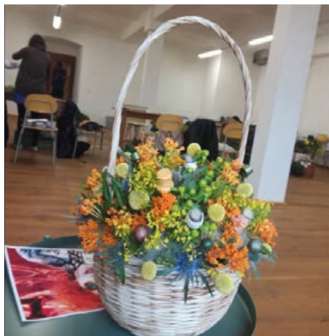
Košík pro Kloboučníka – A. Gregorová