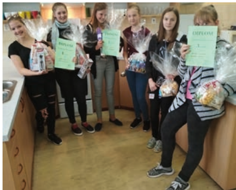
Nejlepší kuchařky byly za své umění náležitě oceněny