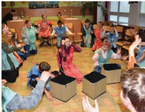
Nový vzdělávací program Strom života přinesl dětem pobavení i poučení

Cílem projektu bylo najít poklad a k tomu, aby se jim to podařilo, musely děti vyluštit tajenku. Po celé trase žáky čekaly úkoly, bez jejichž splnění by se k pokladu nedostali. Museli se seznámit s informacemi