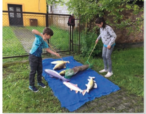
Naši malí rybáři v akci