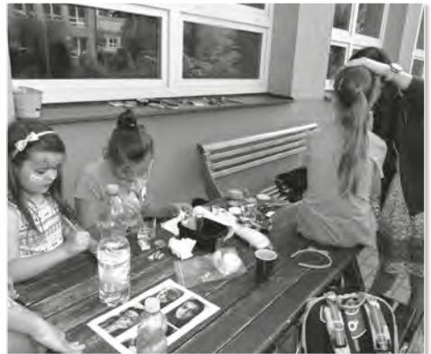
Malování na obličej si našlo mezi dětskými návštěvníky mnoho příznivců.