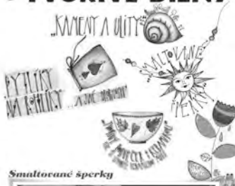
Tvořivý podcecer s keramikou