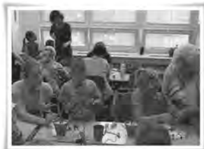
Kamery a ulity