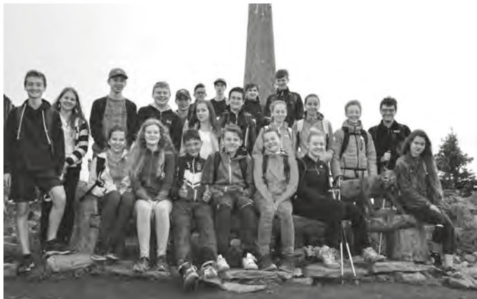
Vrcholová fotografie třídy 8.C

Na vrcholu nás čekal slavnostní oběd v Bezručově chatě, žáci dostali svá vysvědčení a zaslouženou pochvalu, protože se téměř všichni výrazně zlepšili ve srovnání s prvním pololetím. Zdá se, že blížící se starosti s výběrem střední školy žákům 8. C svědčí. Unavení, ale šťastní jsme sestoupili zpět do civilizace a rozloučili