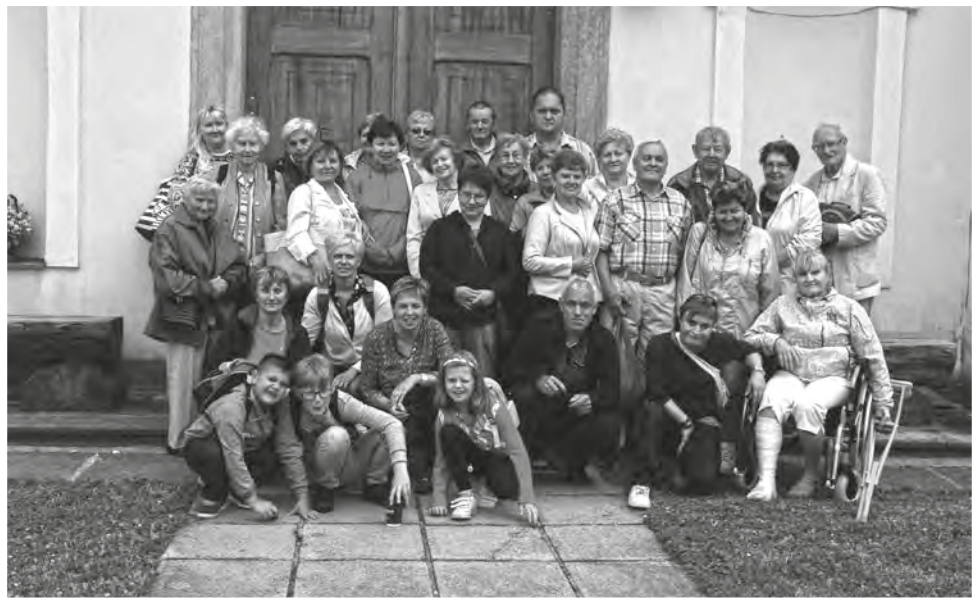
Část poutníků na Horu Matky Boží