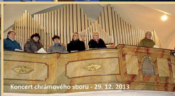
Koncert chrámového sboru - 29. 12. 2013