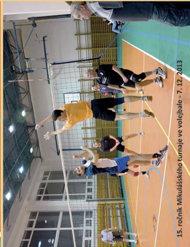
15. ročník Mikulášského turnaje ve volejbalu - 7. 12. 2013