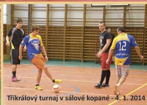
Tříkrálový turnaj v sálové kopané - 4. 1. 2014