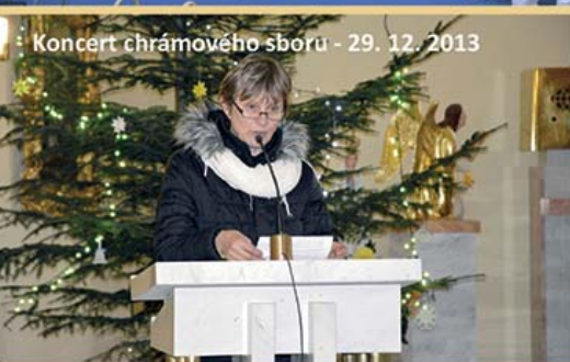
Koncert chrámového sboru - 29. 12. 2013