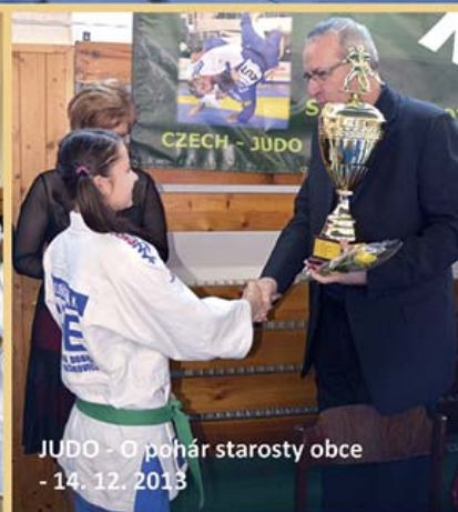
JUDO - O pohár starosty obce - 14. 12. 2013