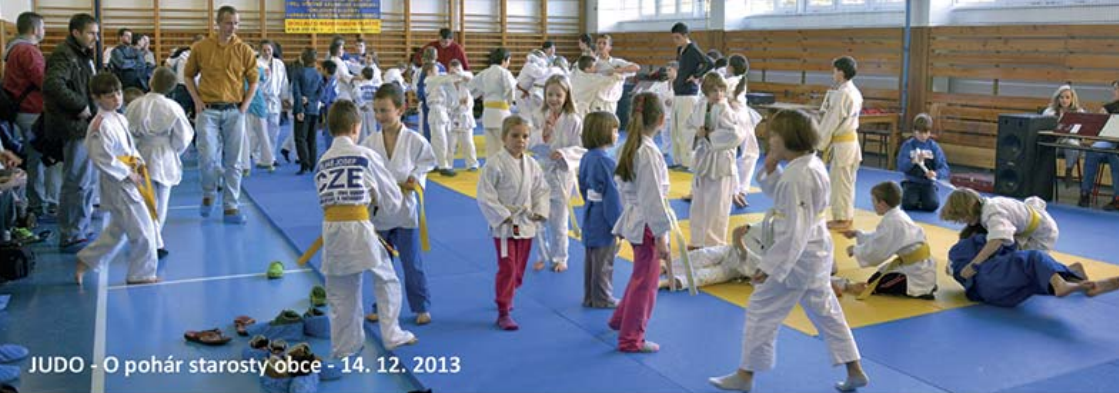
JUDO - O pohár starosty obce - 14. 12. 2013