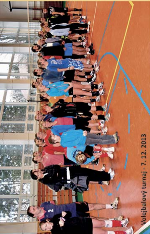
Volejbalový turnaj - 7. 12. 2013