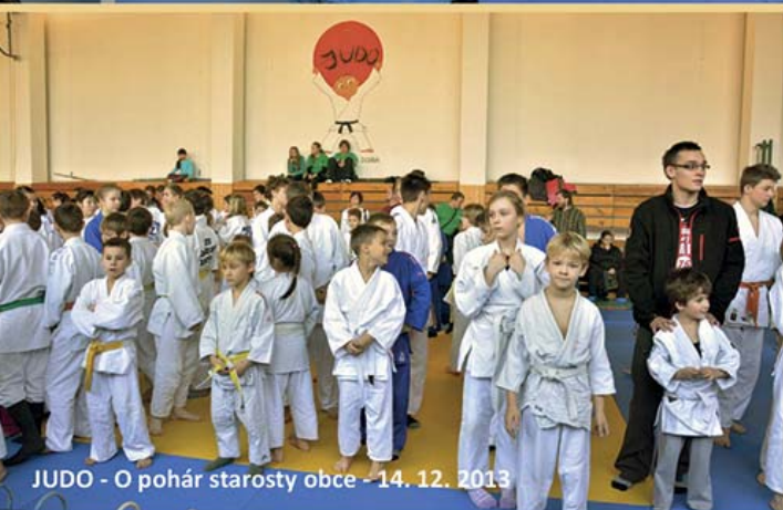
JUDO - O pohár starosty obce - 14. 12. 2013