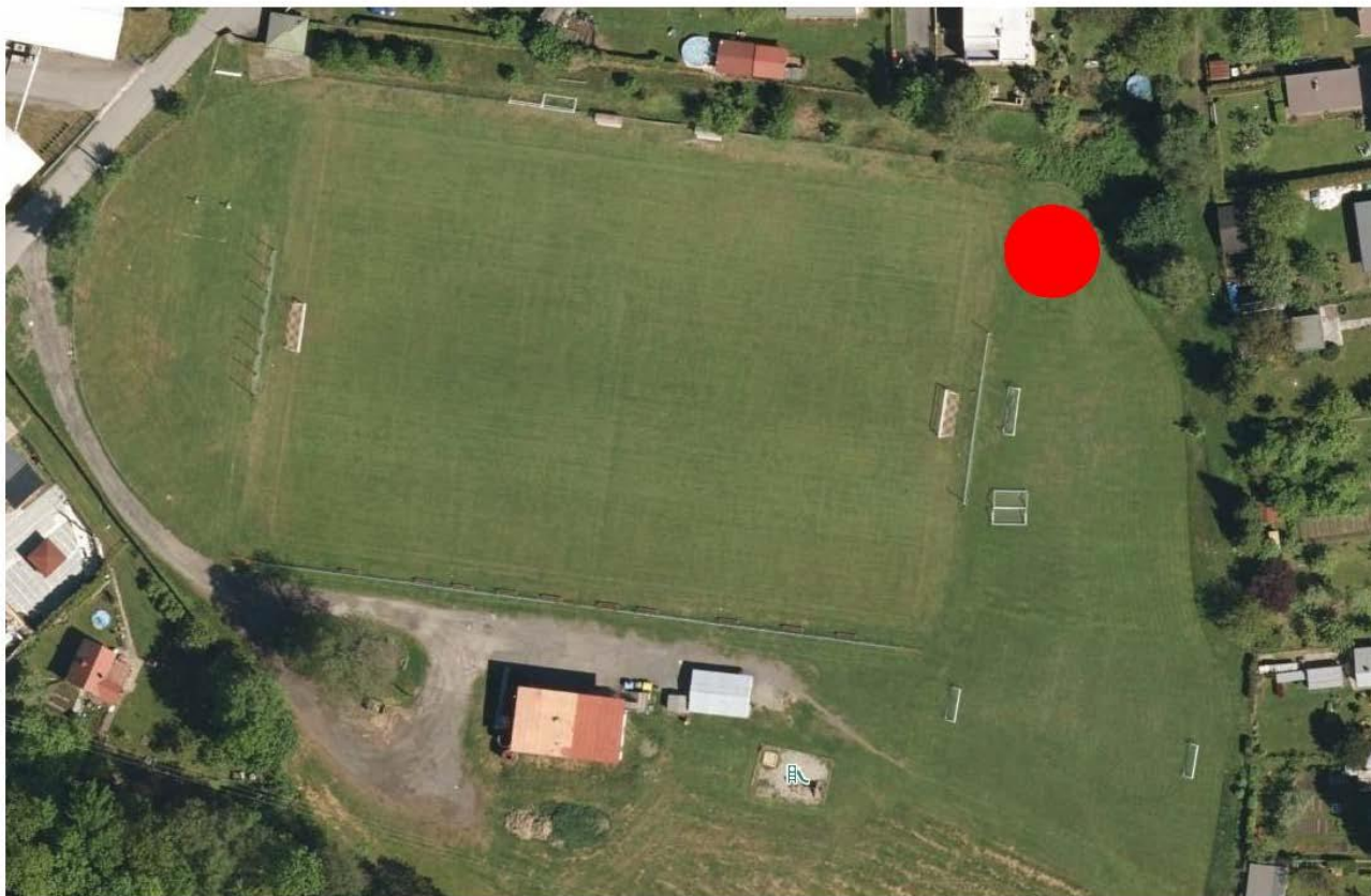
Grafická příloha – umístění Workout hřiště v Dobré