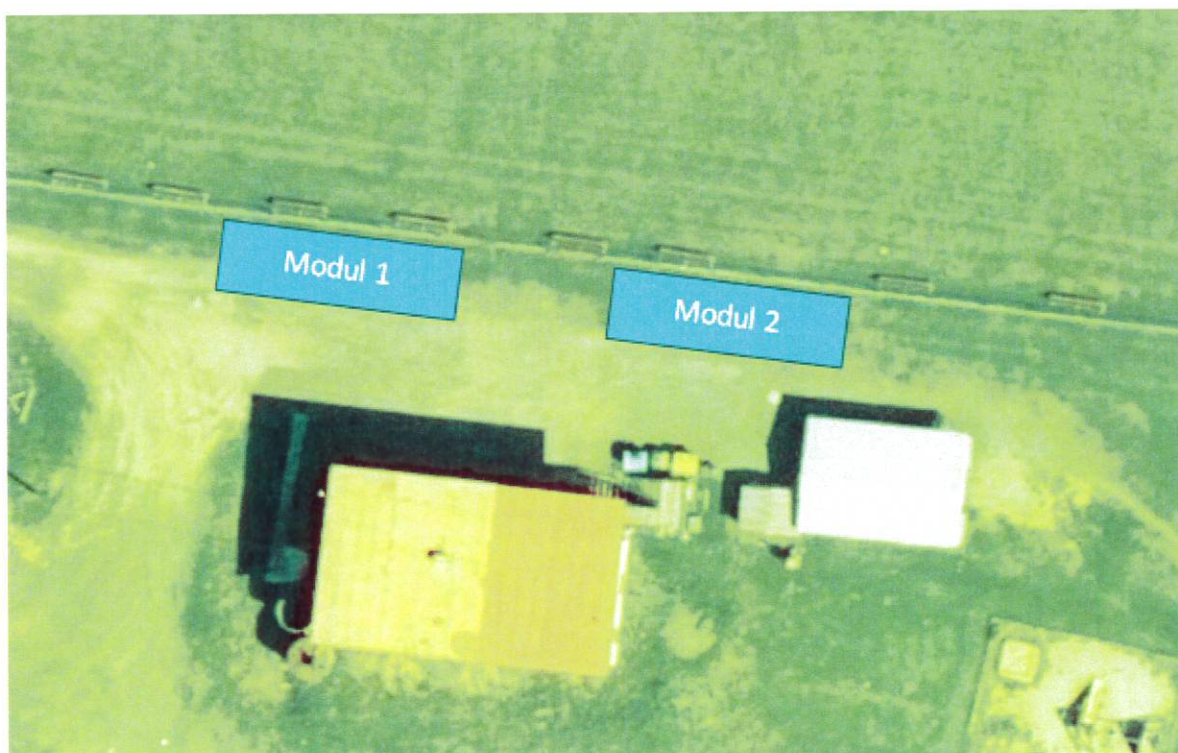
Obrázek 3 – Situační umístění budoucích tribun