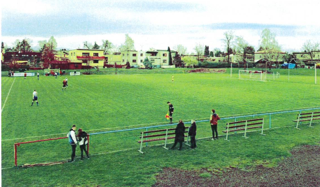
Obrázek 2 - Současný stav sledování sportovního utkání z laviček kolem hřiště