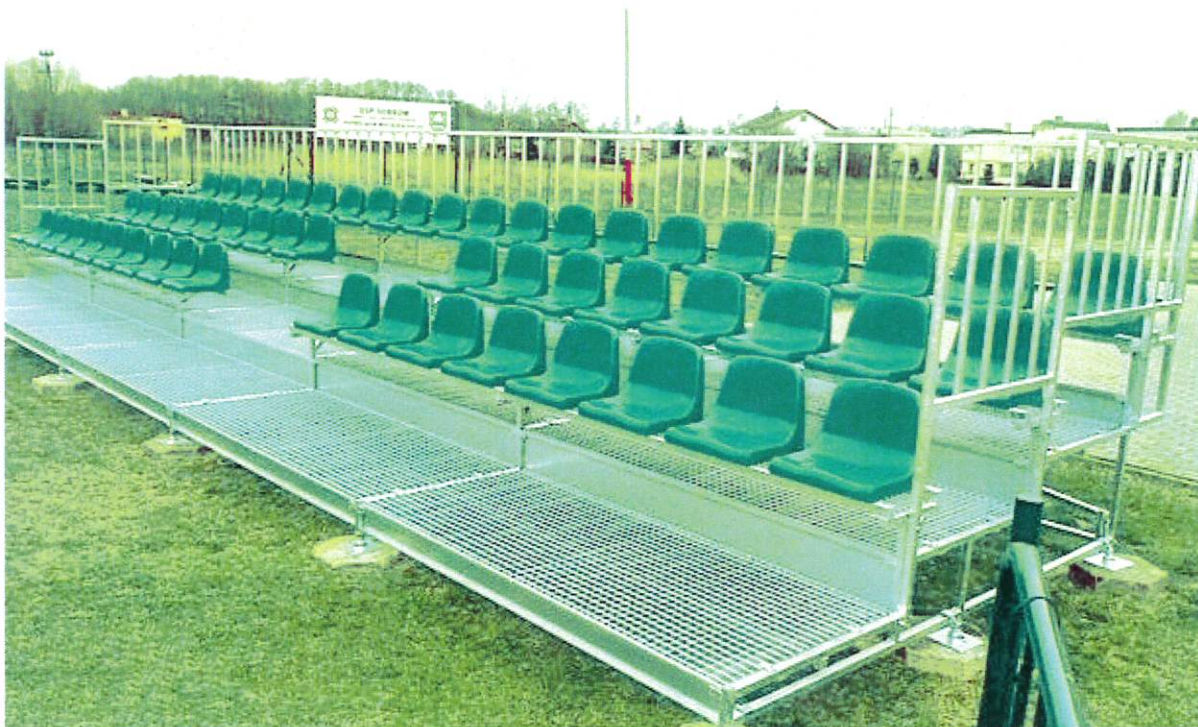
Obrázek 1.a - Ilustrační obrázek podobné realizace