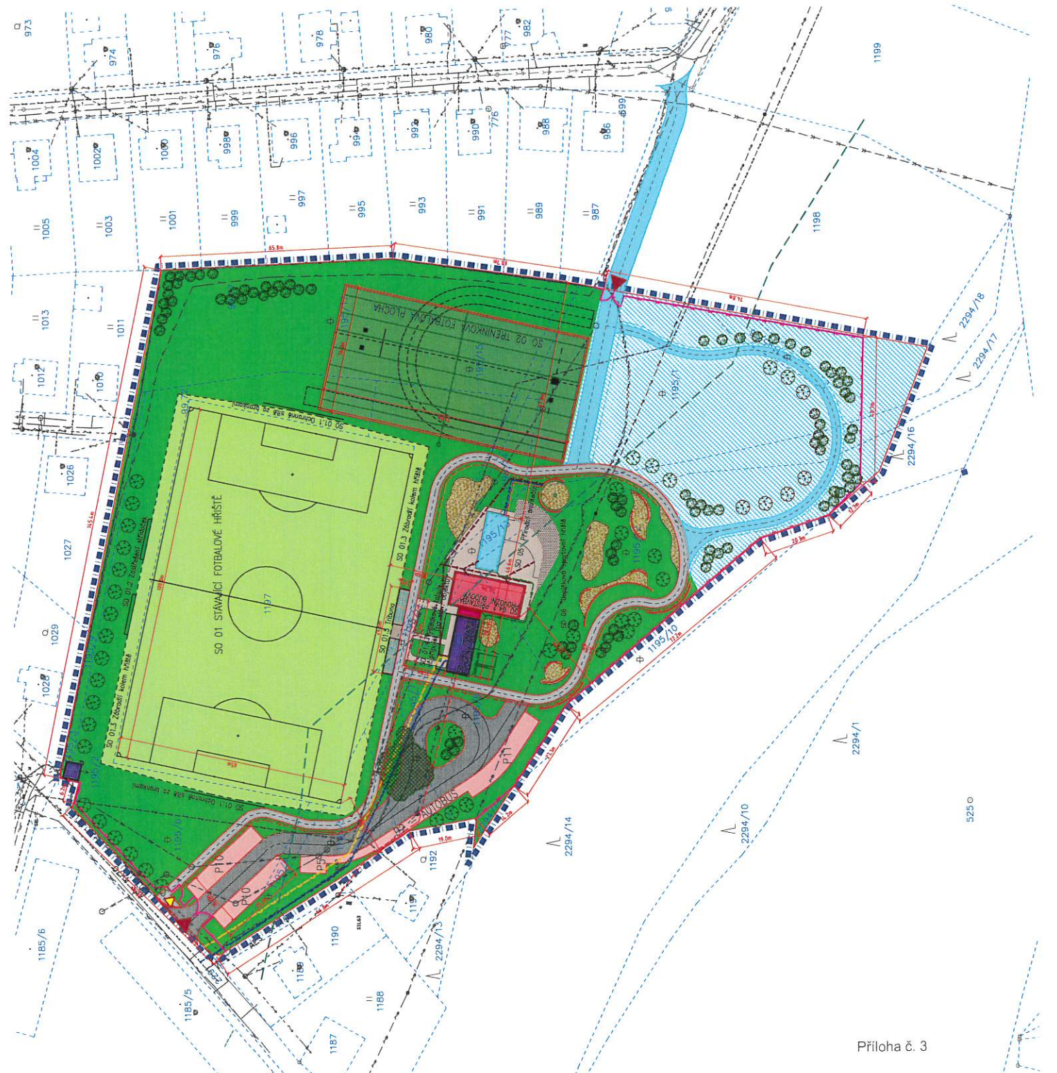
Příloha č. 3